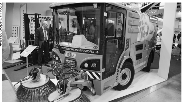
МЗиК создал новую вакуумную подметально-уборочную машину.