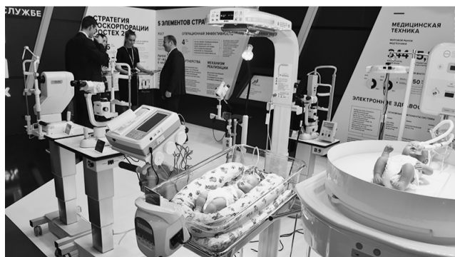
«Швабе» участвует в федеральной программе по строительству перинатальных центров.

Что касается обычных, пилотируемых версий танка «Армата», то в Вооруженные силы России до 2020 года должно поступить 100 единиц техники для опытной эксплуатации.