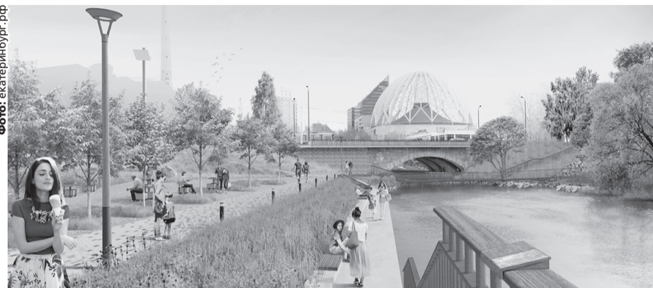
Дизайн-проект благоустройства набережной реки Исеты в Екатеринбурге от ул. Малышева до ул. Куйбышева.

Как сообщили «Уральскому рабочему» в министерстве ЖКХ и энергетики, за три недели в общественные комиссии по благоустройству поступило более 537 тысяч предложений. Самыми активными в продвижении своих объ-