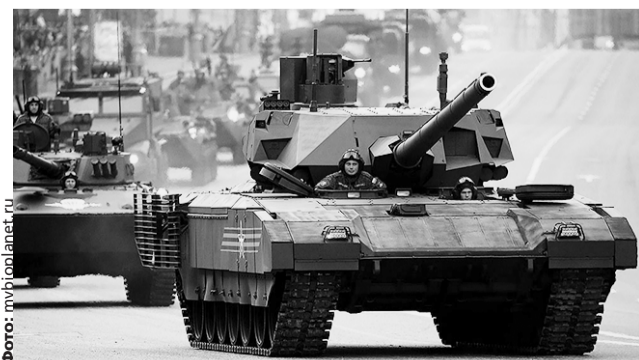
Беспилотная «Армата» будет создана в 2018 году.