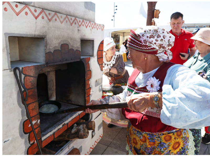
В качестве якорного проекта для привлечения туристов в Ирбит рассматривается и гастрономический туризм.

Разработка виртуального пространства началась в 2020 году, когда Центр получил субсидии от министерства инвестиций. К появлению новинки подтолкнули внешние факторы. Из-за пандемии коронавируса были введены ограничения на посещение всех культурных площадок. И чтобы хоть как-то выйти из изоляции, в Свердловской области начали создаваться виртуальные концертные и выставочные залы. На сегодняшний день онлайн-туры и экскурсии действуют уже