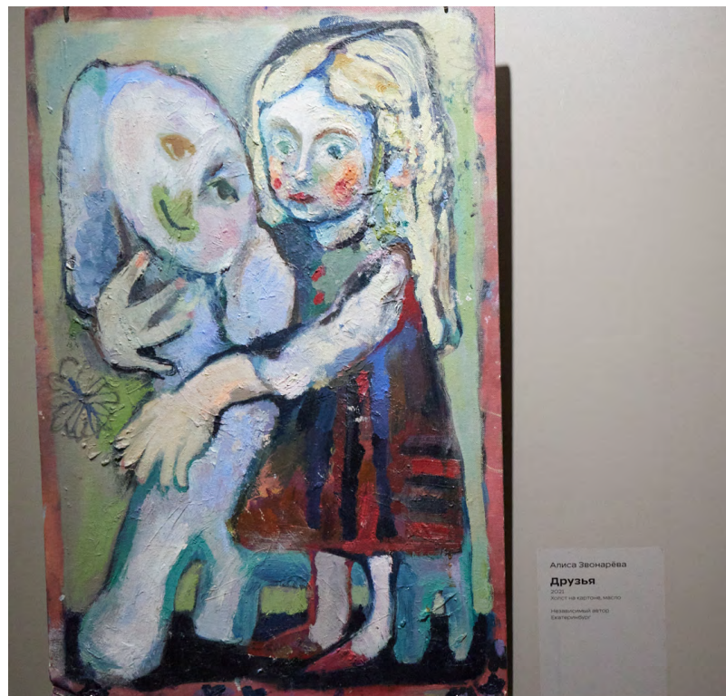
▲ В Музее наива на выставке «Другие измерения. Урал» можно увидеть работы в жанре аутсайдер-арт.