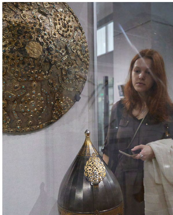
▲ Искусство оружия Ближнего Востока представлено на выставке «Узоры золота на стали...» в центре «Эрмитаж-Урал». Фото: Елена Ельцова

▼ В Областном перинатальном центре прошло информационно-познавательное мероприятие, посвященное Всероссийскому дню беременных. Фото: Елена Ельцова