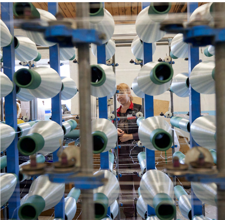
▲ Уральский производитель строительных материалов «Изомакс Рус» благодаря сотрудничеству с СОФПП заключил контракты с иностранными заказчиками.