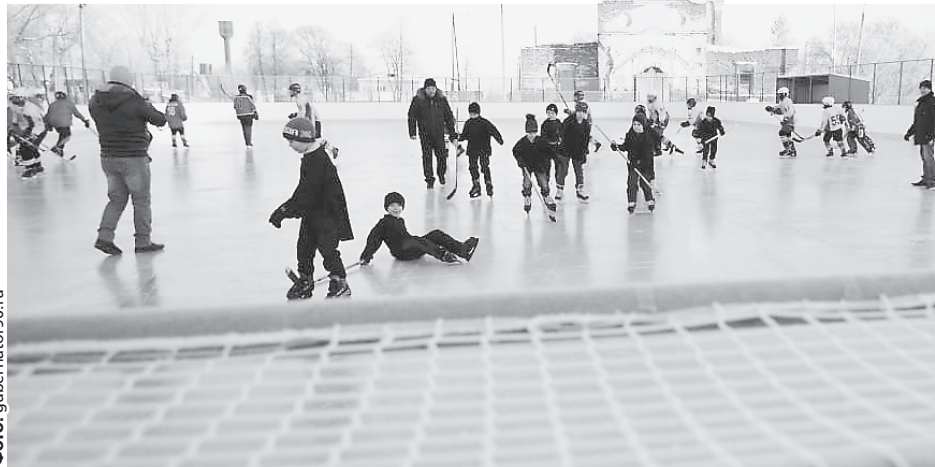
Хоккейные ворота на ледовой площадке сегодня штурмуют школьники села Коптелово в Алапаевском районе. Наконец спортплощадка из аварийной превратилась в новую. На реставрацию объекта в 2018 году областной и местный бюджеты выделили 17 миллионов рублей.