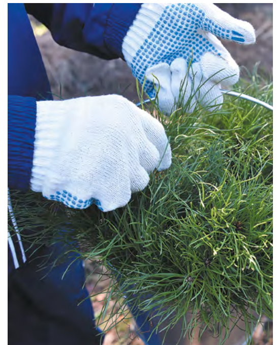
▲ На месте рекультивированной свалки бытовых и промышленных отходов в Арамиле высажены деревья.