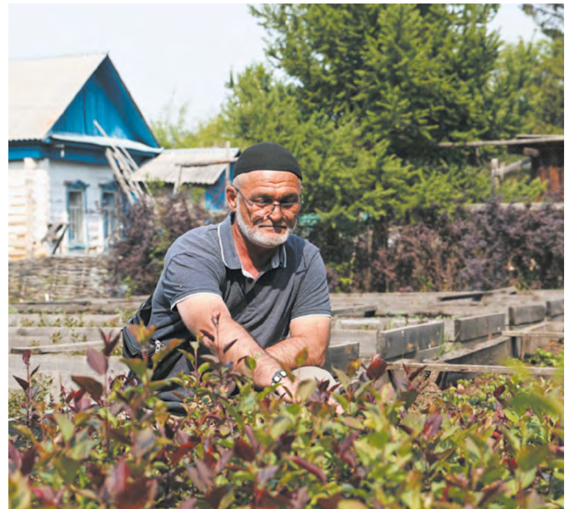
▲ В екатеринбургском питомнике декоративных растений Зеленстрой, где растет миллион деревьев, работает 14 человек.