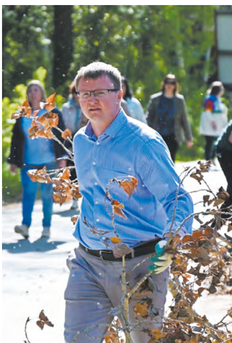
▼ Участники акции «Чистый берег» собрали на берегу Шарташа 200 мешков мусора.