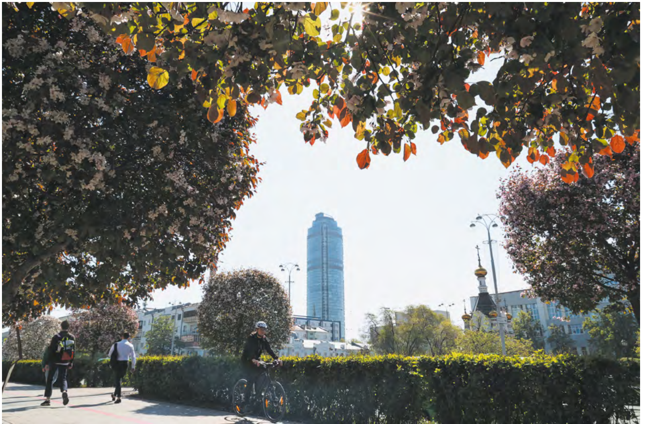
▲ Екатеринбургское лесничество за 5 лет высадило в городе 312 тысяч деревьев. Одна из главных задач лесоводов — восстановление зеленого каркаса уральской столицы.

Отдать свой голос за тот или иной объект можно на сайте 66.gorodsreda.ru , на Госуслугах в разделе «Общественное голосование» или при помощи волонтеров