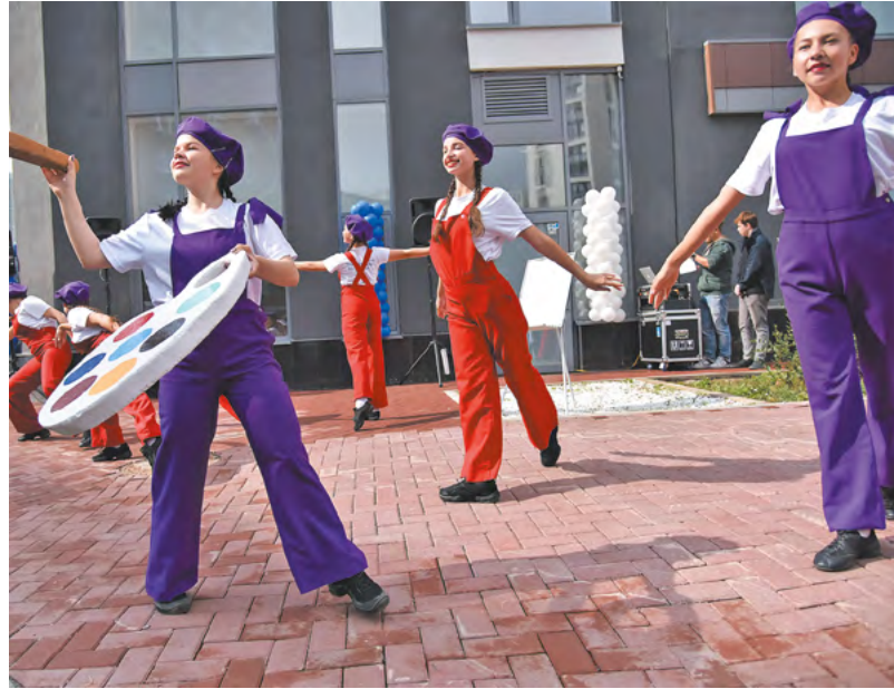
Заниматься творчеством юные свердловчане могут в 162 детских школах искусств.

При этом с каждым годом расширяется не только тематика постановок, но и театральные фестивали. С 18 по 23 мая в Екатеринбурге прошел форум-фестиваль социального театра «Особый взгляд», посвященный проблемам инклюзии. Впервые мероприятие состоялось в Москве в 2019 году, затем в 2021 году в Казани, а в этом году фестиваль принял Екатеринбург. По словам организаторов, выбор Свердловской области не случаен, поскольку Средний Урал — «живой» регион, где есть свой социальный театр.