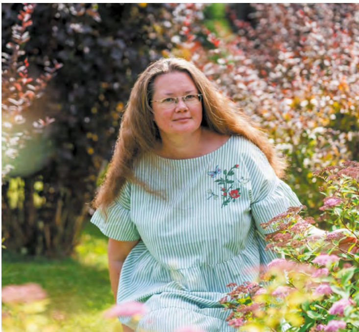
▲ Свердловские медики присоединились к экологической неделе: вывезли пять КамАЗов мусора, высадили живую изгородь и провели фотосессию в яблоневом цвету.