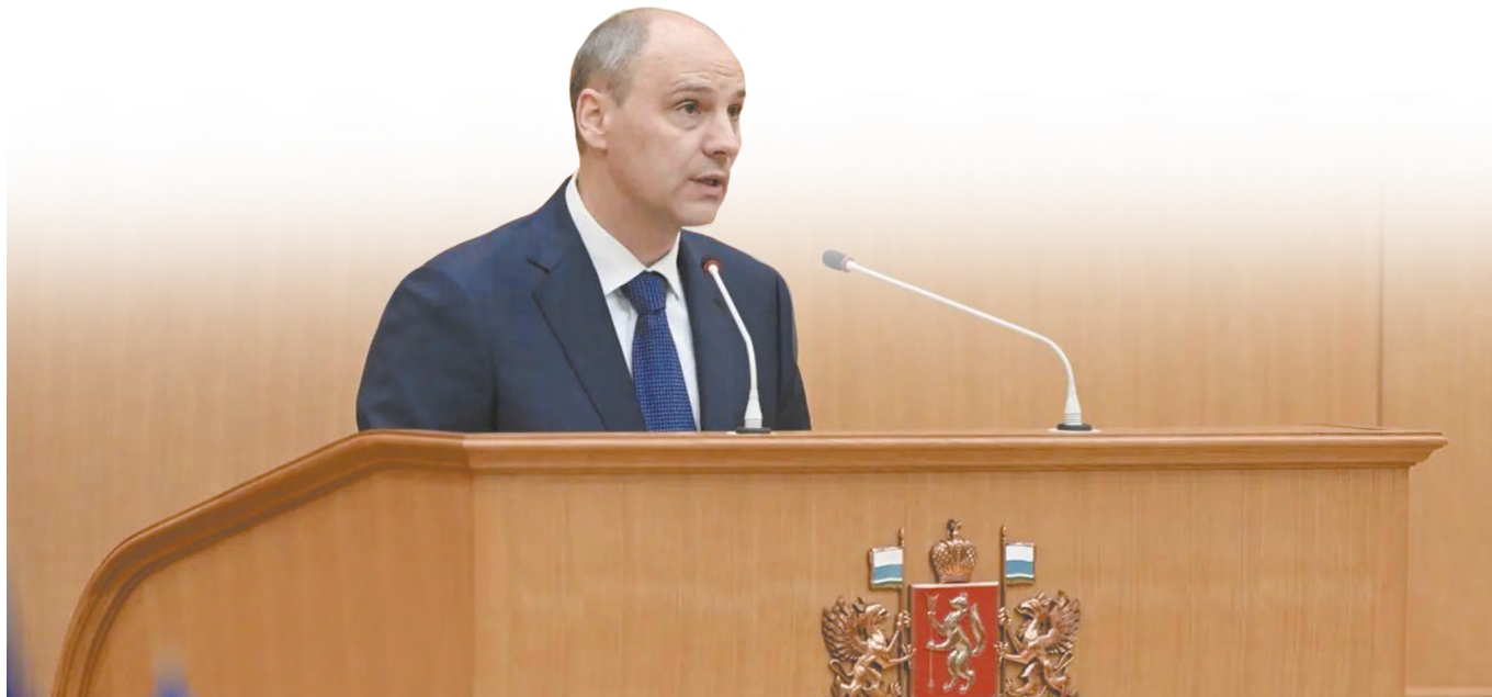
Денис Паслер особо подчеркнул: власть делала, делает и будет делать все, чтобы молодежь строила свое будущее в Свердловской области — училась, работала, жила и создавала семьи в родном регионе