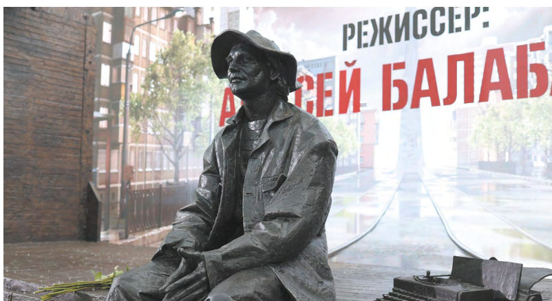
▲ Первый в России памятник легендарному режиссеру Алексею Балабанову открыли в уральской столице. 10-тонный монумент, изображающий режиссера, который сидит в трамвае, установлен у Дворца молодежи