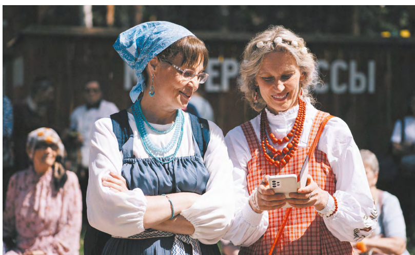
▲ В парке Маяковского отпраздновали День России, посвятив программу не только государственному празднику, но и Году единства народов великой страны