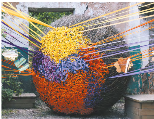
▲ «Винтажные выходные» - трехдневный фестиваль прошел в Сысерти с 12 по 14 июня. Он был посвящен вещам с историей, которые хранят память и обретают новую жизнь