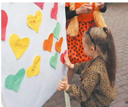
▲ 27 тысяч свердловчан отметили Международный день соседей, встретившись на площадках, благоустроенных по проекту «Формирование комфортной городской среды»