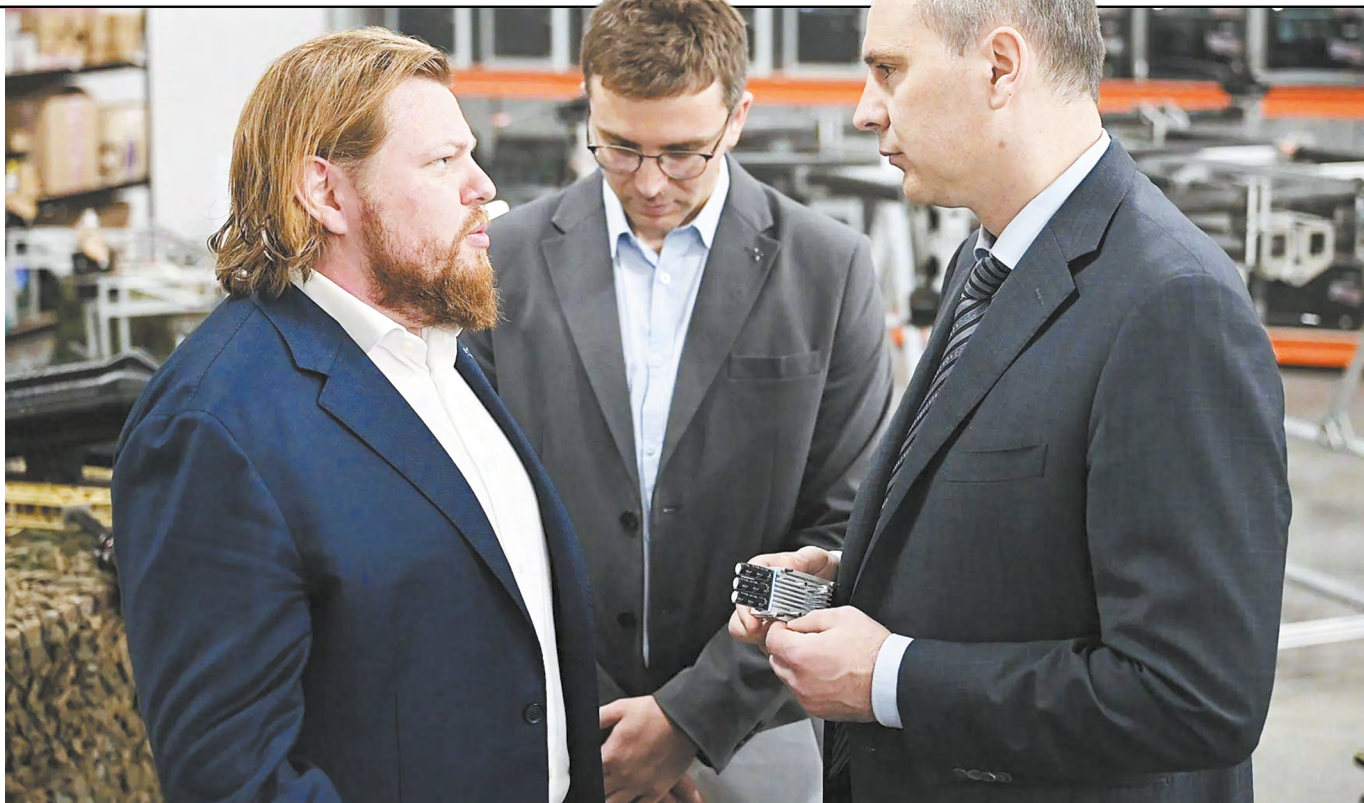
▲ Губернатор Денис Паслер посетил предприятие «Авирон». Уже десять лет конструкторское бюро компании ведет разработки в сфере беспилотной связи