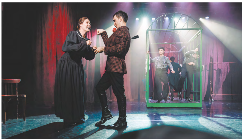
▲ В Верхней Пышме закрыли театральный сезон премьерой по Чехову: «Душечка» на сцене