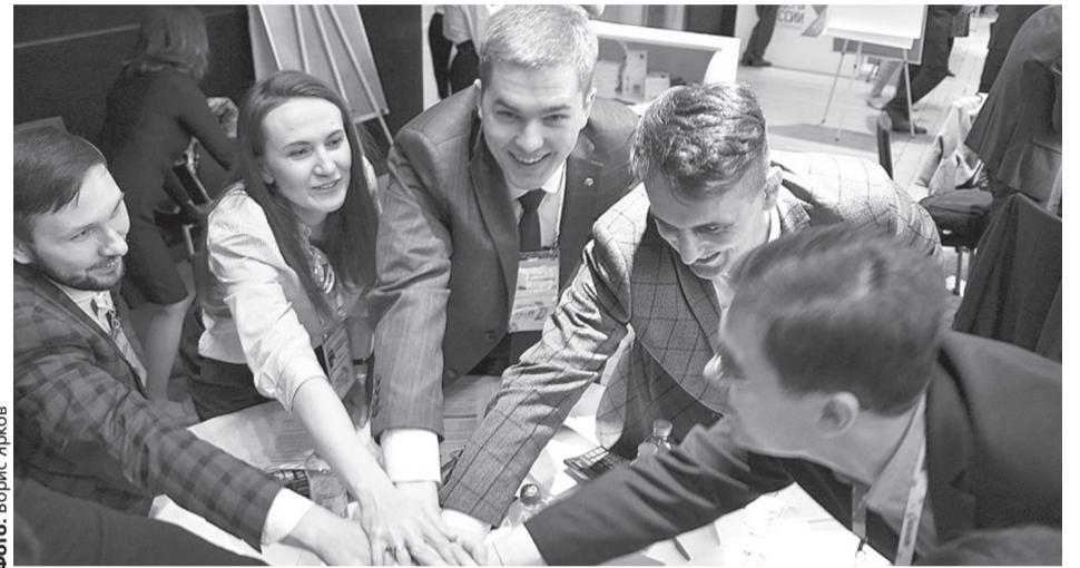
Одна из конституционных поправок касается создания условий для экономического роста и уверенности в завтрашнем дне

Таким образом, обеспечение социального партнерства, предложенное в поправках в Конституцию, только усилит взаимодействие власти, бизнеса и общества.