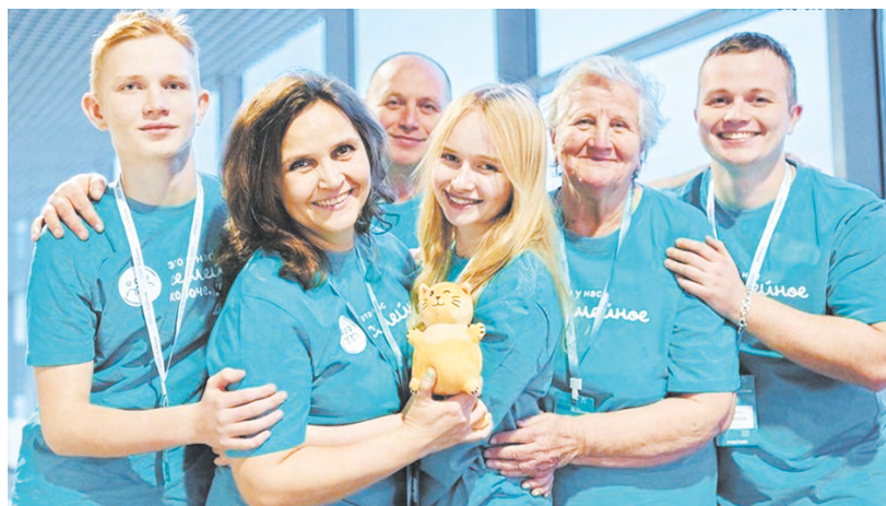
▲ Многодетным семьям оказывается комплексная поддержка: от социальных выплат до поощрения матерей региональными знаками отличия Фото сверф