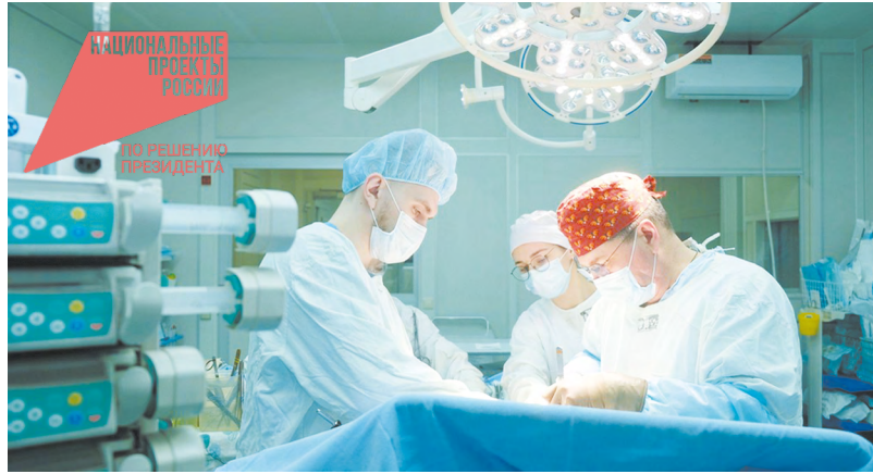
Около восьми часов продолжалась операция по удалению гигантского новообразования

Заранее предусмотрели многие нюансы. Хирургическое вмешательство было сопряжено с риском массивной кровопотери и тромбоза. Поэтому подготовили систему реинфузии для возврата собственной