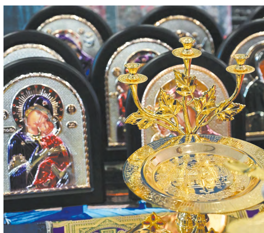
▲ Православная ярмарка «Русь крещеная, святая» в Екатеринбурге собрала участников из разных стран