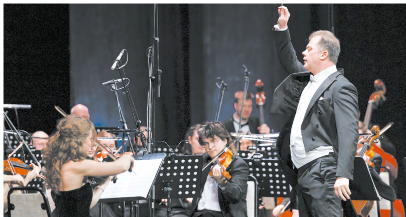
▲ Уральский молодежный оркестр открыл Саммит талантов в Казахстане