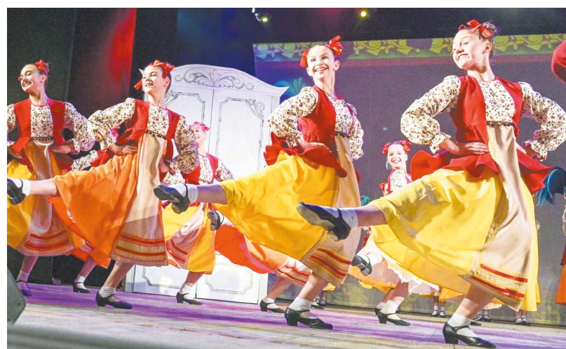
▲ Тагильский ансамбль «Родничок» удостоен звания «Заслуженный коллектив народного творчества»