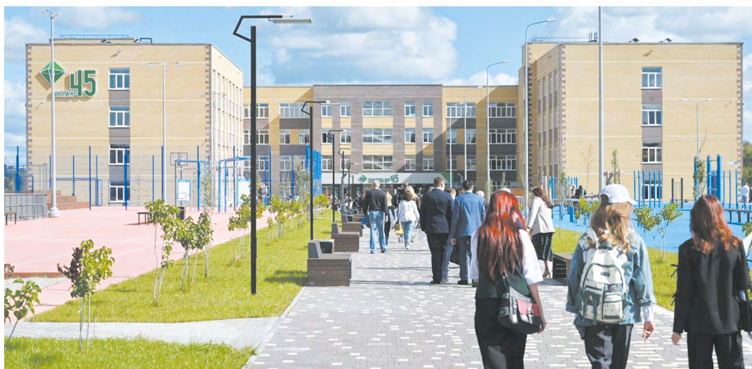
Свердловская власть не словами, а конкретными средствами показывает, как важна для региона сфера образования. Школы и детские сады должны быть не только доступны, но еще удобны и комфортны

— Финансирование на организацию бесплатного горячего питания для учеников начальной школы вырастет на 600 миллионов рублей по сравнению с прошлым годом, — уточняет департамент информполитики области. — Учителям продолжатся выплаты вознаграждений за классное руководство в размере 5 тысяч рублей в городах с численностью более 100 тысяч человек. 10 тысяч рублей предусмотрено педработни-