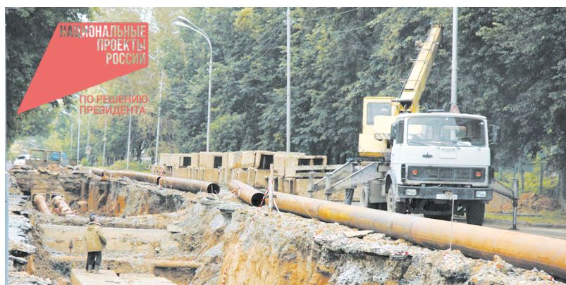
В прошлом году заменено около 240 километров тепловых, 255 километров водопроводных и 95 километров канализационных сетей

В Свердловской области ведется системное обновление инженерных сетей при подготовке к отопительному сезону. По словам главы региона, в планах до 2030 года построить новые котельные, очистные сооружения, модернизировать порядка 2 тысяч объектов ЖКХ, в том числе включенных в Народную программу партии «Единая Россия» по обращениям жителей.