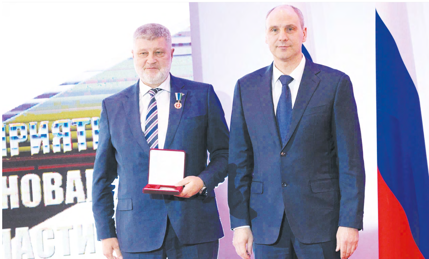
▲ Губернатор Свердловской области Денис Паслер вручил выдающимся уральцам государственные и региональные награды