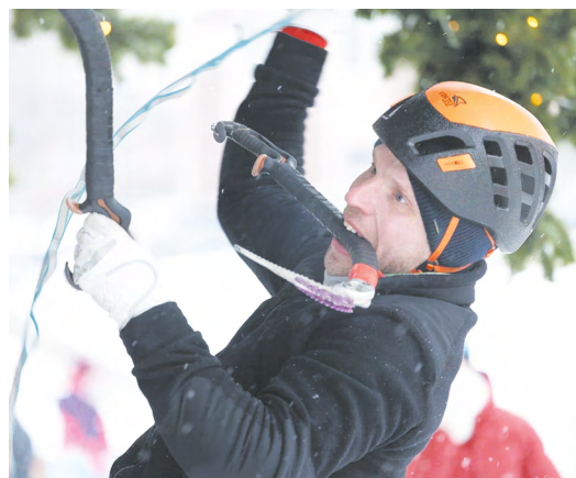
▲ Волна веселья накрыла ледяную крепость: как екатеринбуржцы штурмовали главный арт-объект зимы