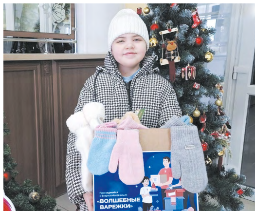
▲ Сила первых: 65 тысяч жителей Свердловской области стали участниками новогодних акций «Движения Первых»