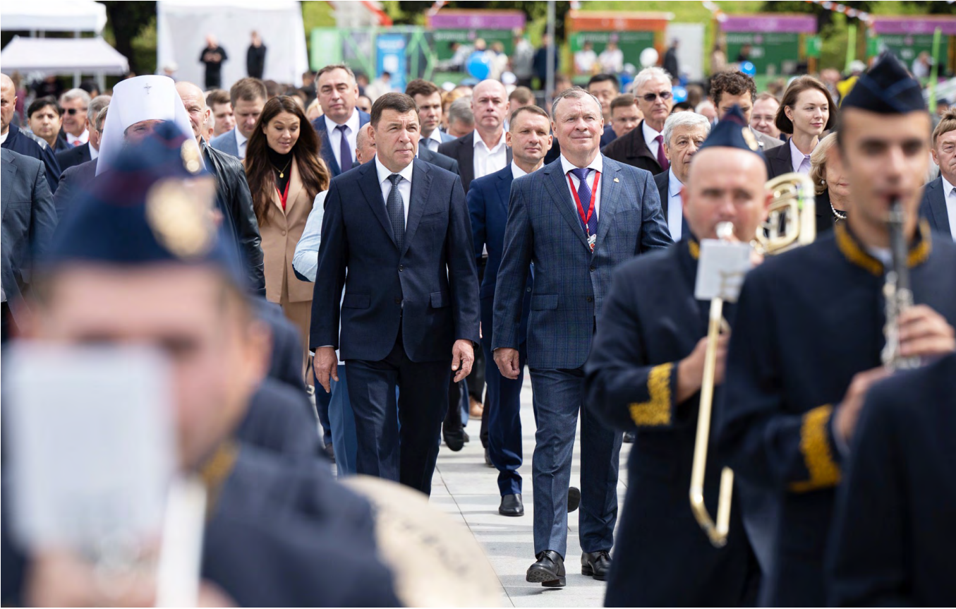
▲ Губернатор Евгений Куйвашев и мэр Екатеринбурга Алексей Орлов приняли участие в праздновании Дня города.