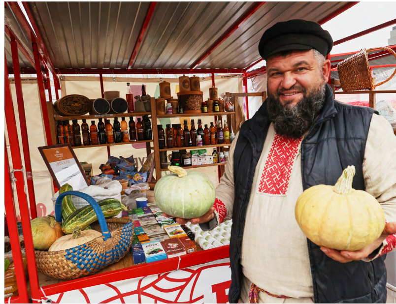
В этом году аграрии планируют собрать более 700 тысяч тонн зерна, 255 тысяч тонн картофеля и 44 тысячи тонн овощей.

и стабильность поставок продукции на Среднем Урале», — отметила глава ведомства.