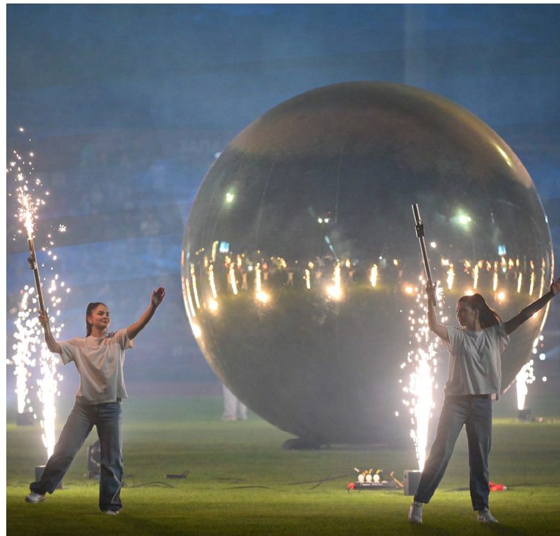
▲ На екатеринбургском стадионе «Калининец» состоялось шоу, посвященное 100-летию свердловского спорта и Дню физкультурника.