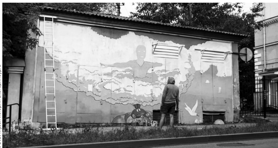
Граффити, которыми художники продемонстрировали эпизоды аудиоспектаклей