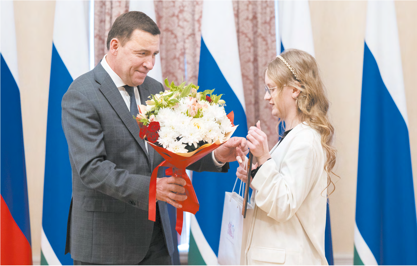
▲ Финалисты международной премии #МЫВМЕСТЕ рассказали губернатору Евгению Куйвашеву о своих волонтерских проектах.