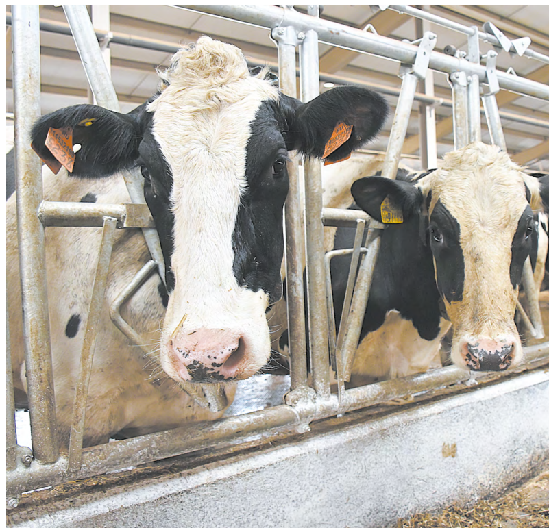
▲ Более 870 миллионов рублей направлено 170 свердловским предприятиям и хозяйствам – производителям молока.