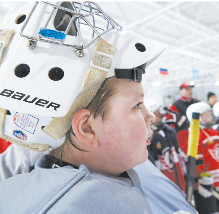
▲ Юные хоккеисты из Екатеринбурга отправились в ОАЭ на сборы в рамках сотрудничества Свердловской области со странами Ближнего Востока.