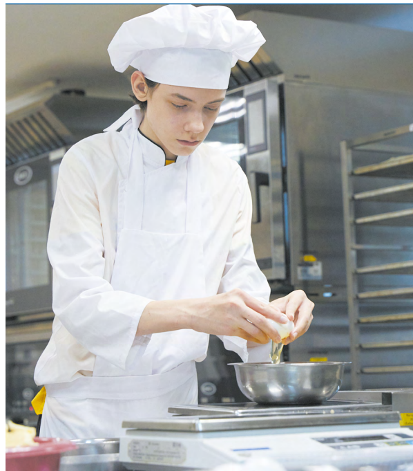
▲ Более 500 студентов уральских колледжей и техникумов стали победителями регионального этапа чемпионата «Профессионалы». Фото: Елена Ельцова

▼ Выставка «Екатерина I – наследница дел Петра Великого» вошла в тройку самых посещаемых экспозиций центра «Эрмитаж-Урал». Фото: Елена Ельцова