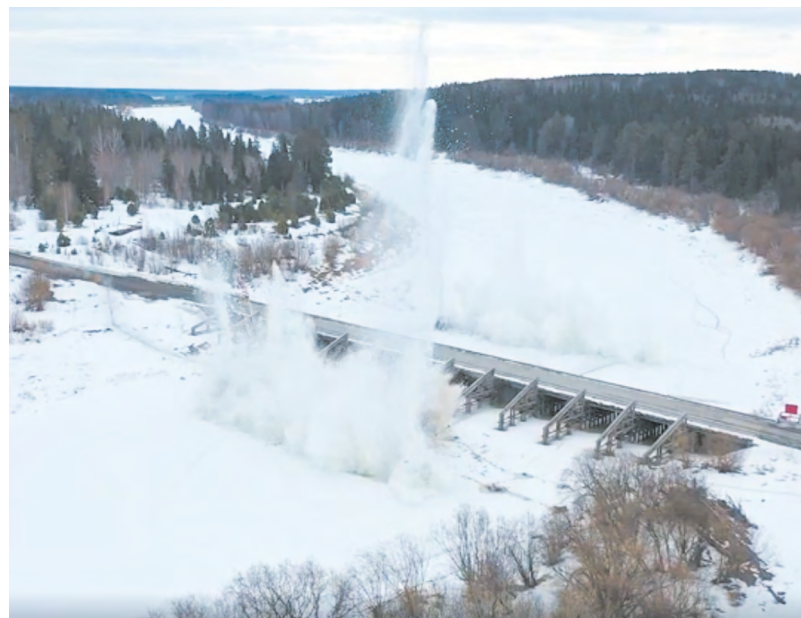
Около четырех килограммов взрывчатки потребовалось, чтобы расколоть глыбы льда у одного из мостов.

обилие снега должно компенсировать прошлогоднюю засуху. Но сказать со 100-процентной уверенностью, что нигде не возникнет подтоплений, невозможно. По словам Дениса Мамонтова, в ближайшее время еще будут наблюдаться чередования оттепели с похолоданием, поэтому объем воды в реках может возрасти.