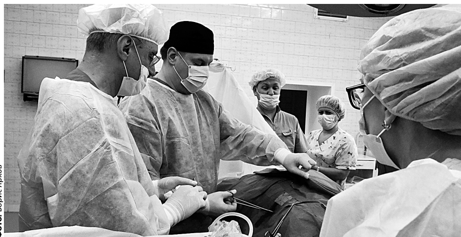
Специалисты медицины должны быть готовы к работе в новых условиях цифровой экономики