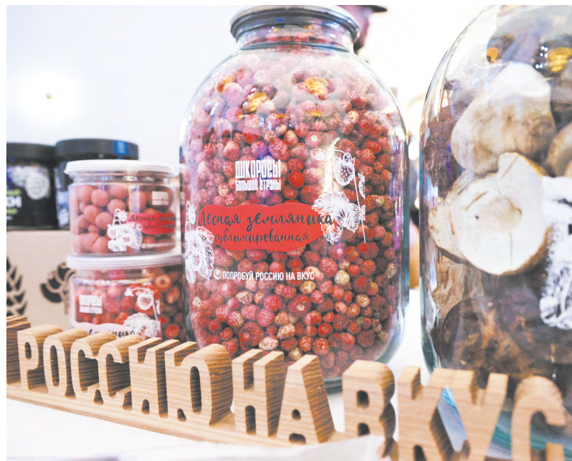
Уральские деликатесы по достоинству оценили посетители выставки «Россия» на ВДНХ.

авторы проекта выстраивают сотрудничество со Свердловской и Пермской пригородными компаниями.