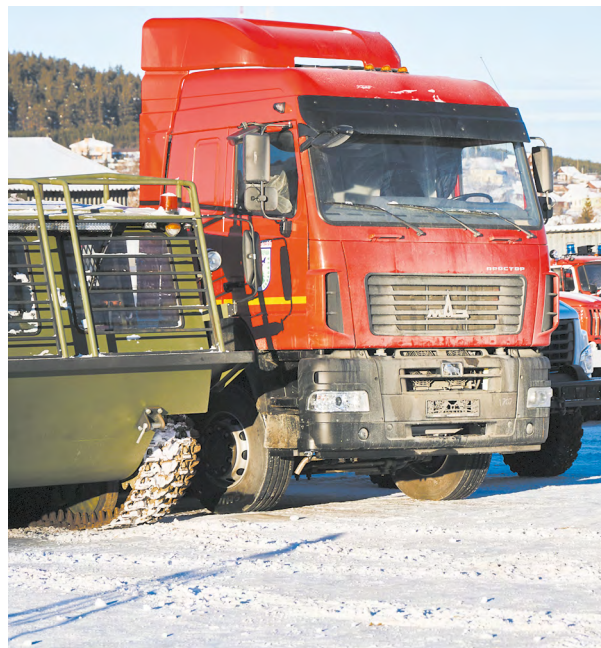
▲ Для тушения лесных пожаров на Среднем Урале закуплено более 30 единиц техники на сумму 230 миллионов рублей. Фото: Елена Ельцова

▼ В Уральской консерватории имени Мусоргского состоялась презентация эскиза оперы «Синюшкин колодец» композитора Максима Баска. Фото: Елена Ельцова