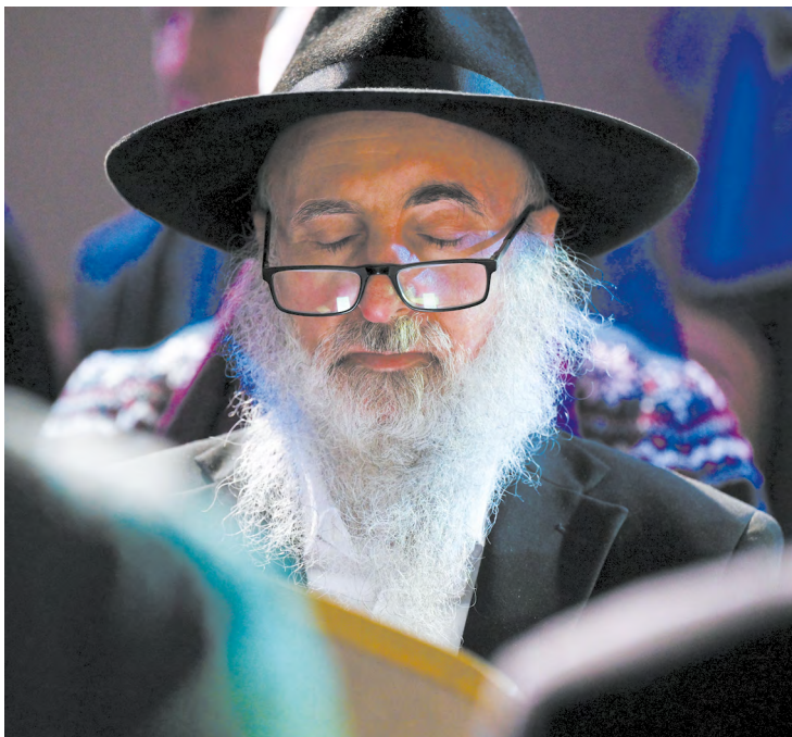
▲ В Екатеринбурге накануне Международного дня памяти жертв Холокоста прошла торжественно-траурная церемония.