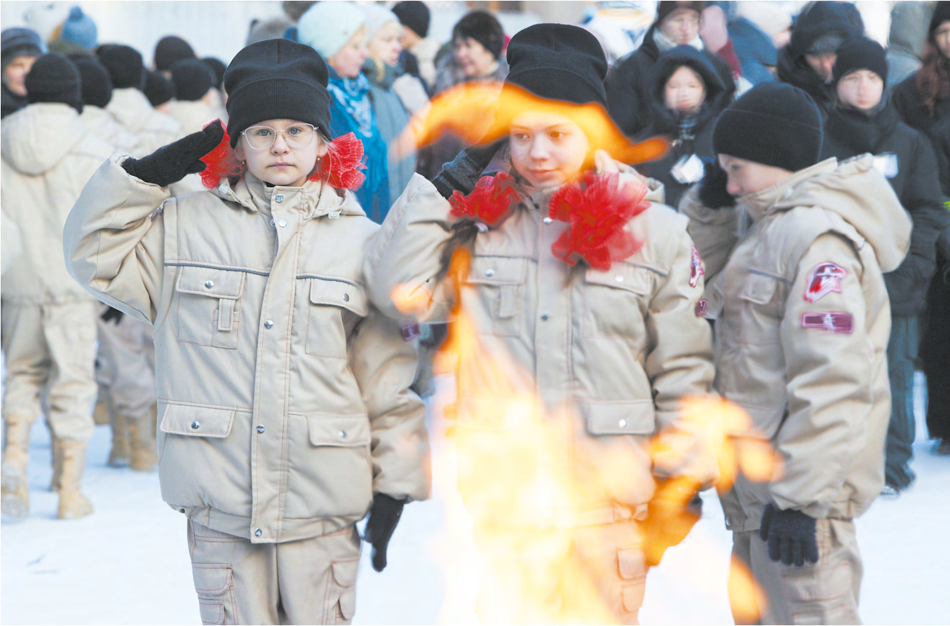
▲ Уралыцы приняли участие в мероприятиях, посвященных 80-летию полного освобождения Ленинграда от фашистской блокады.