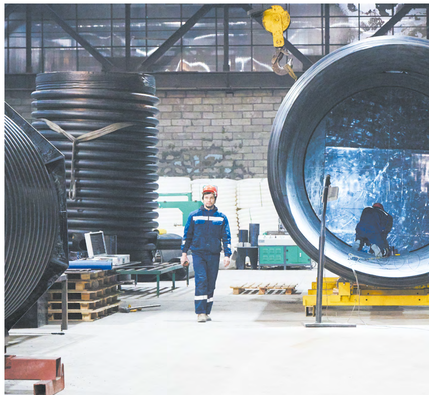
▲ На заводе «ИнПластПолимер» в Заречном стартовало производство полиэтиленовых труб большого диаметра для магистральных водопроводов.