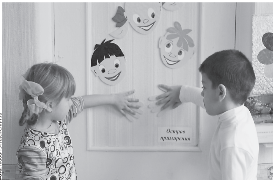
Школьные медиаторы с 2014 по 2017 год провели 725 процедур примирения, а в 2018 году – 305.

– На территории области функционируют 510 школьных служб примирения, из них 179 были созданы в этом учебном году. Такие службы созданы в Екатеринбурге, Каменске-Уральском, Нижнем Тагиле, Первоуральске и других городах. По данным министерства общего и профессионального образования Свердловской области, практиче-