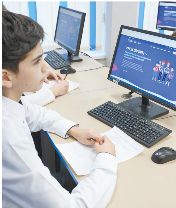
▲ На первом в новом году «Уроке цифры» уральские школьники изучали искусственный интеллект.