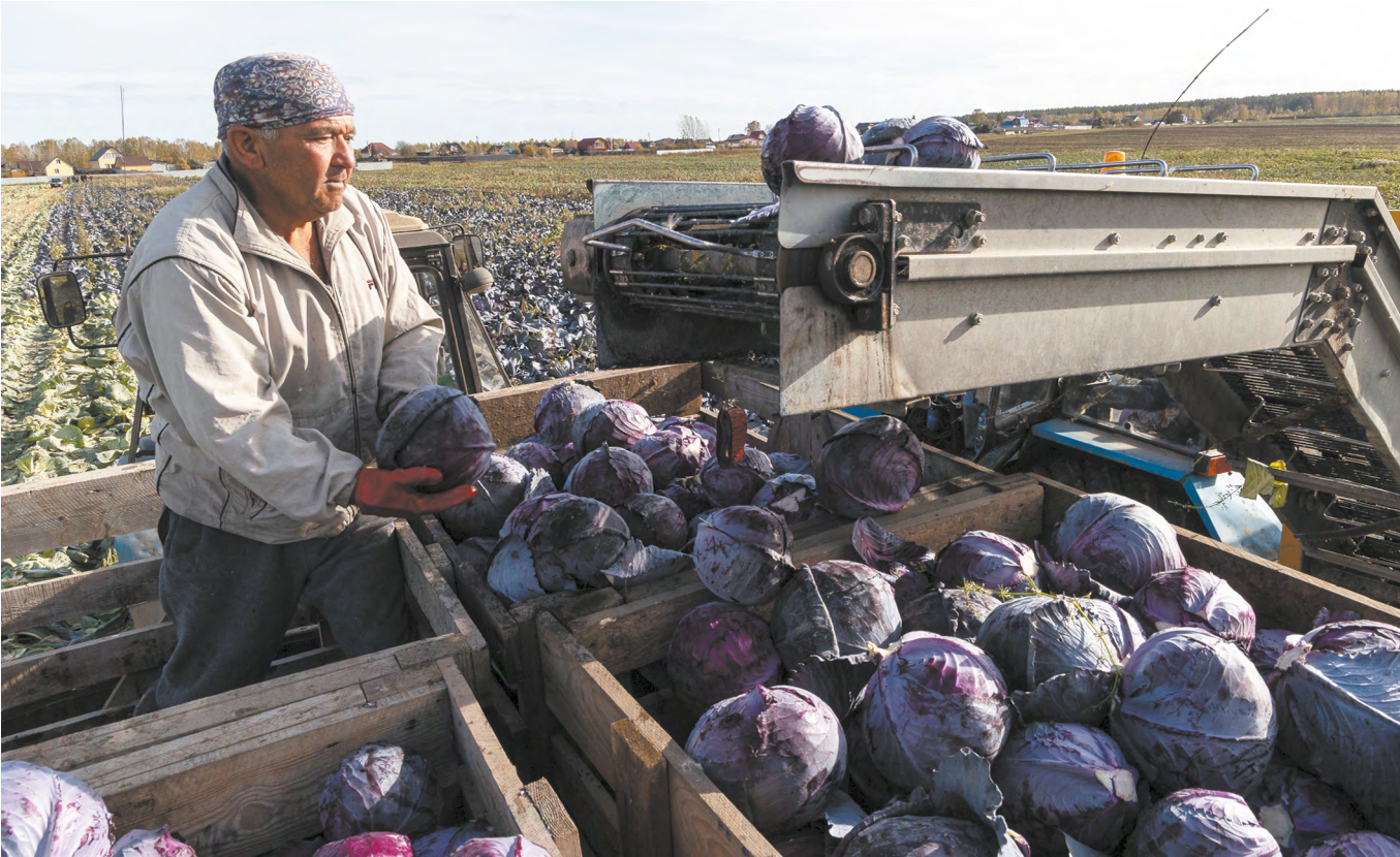
▲ Аграрии Среднего Урала собирают свыше 600 центнеров капусты и более 450 центнеров моркови с каждого гектара – урожайность овощей выше, чем в прошлом году.