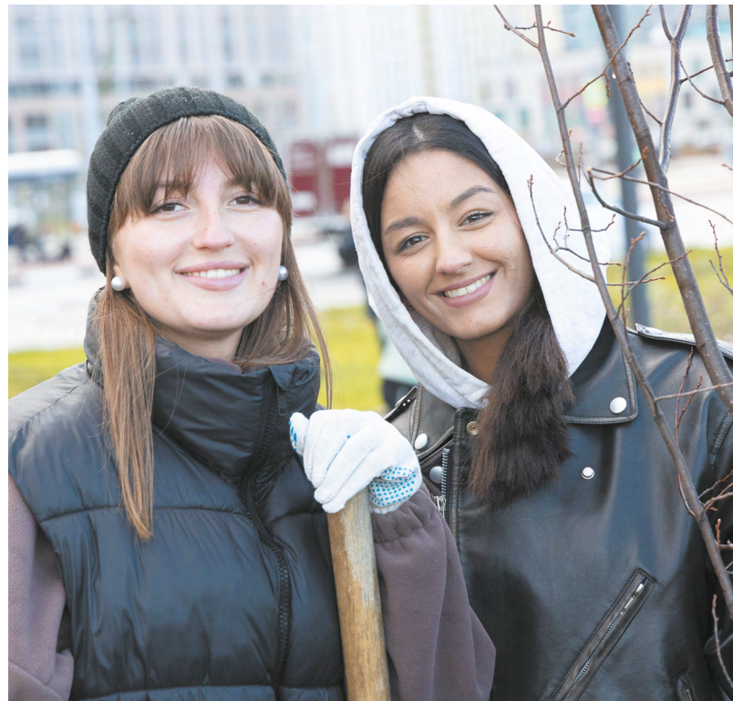
▲ На улице Академика Парина в Академическом районе Екатеринбурга уральские экономисты заложили кленовую аллею.