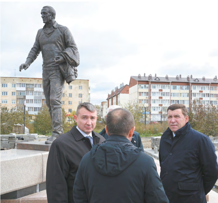
▲ Губернатор Евгений Куйвашев в Верхней Салде оценил работу кластера «Перспектива» для школьников и благоустройство парка имени Тетюхина.

▼ Память Александра Маслякова почтили аплодисментами на Кубке губернатора Свердловской области по КВН.