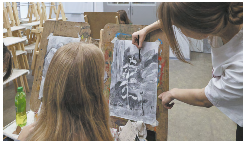
По количеству школ искусств Свердловская область находится в числе лидеров среди регионов России.

Одно из преимуществ центра — это большое количество семинаров, мастер-классов, научно-практических конференций, летних творческих школ, международных мероприятий. Например, только за прошедший сентябрь поддержка была оказана нескольким конкурсам. Среди них — на серию стажировок для студентов в Уральском государственном театре эстрады, Центре креативных прототипов Учебного театра ЕГТИ и детской художественной школе Новоуральска. Помощь получил областной конкурс преподавателей «Грани мастерства». Разработка фирменного стиля Молодежного культурного форума Свердловской области, который впервые пройдет в регионе и станет главным событием для поддержки молодых педагогов искусств, тоже осуществлялась «под крылом» регионального ресурсного центра.