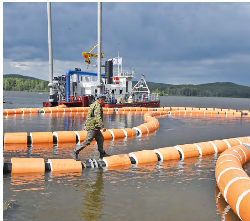
Донные отложения попадают в пульпопровод длиной около 3,5 километра, по пути в смесь добавляется безопасный реагент, который отделяет воду от ила

навы. Оттуда вода попадает в отстойник, а затем вытекает в реку Черную», – объяснил технологию очистки заместитель директора «Тагилдорстроя» Эдуард Белко.