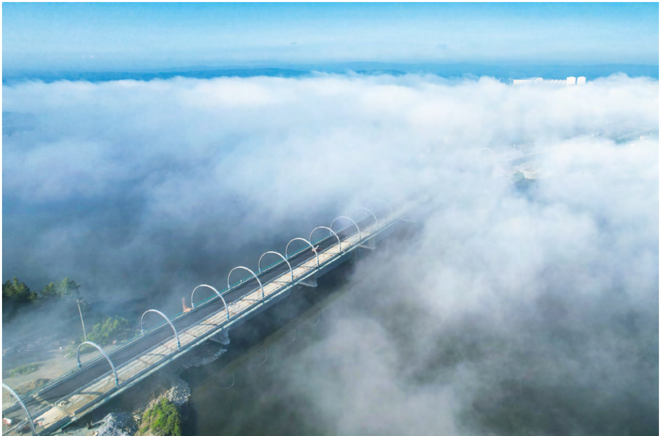
▲ Завершается строительство моста через городской пруд в Нижнем Тагиле. Финал грандиозного проекта стоимостью почти пять миллиардов рублей намечен на 12 августа — в день 300-летия города