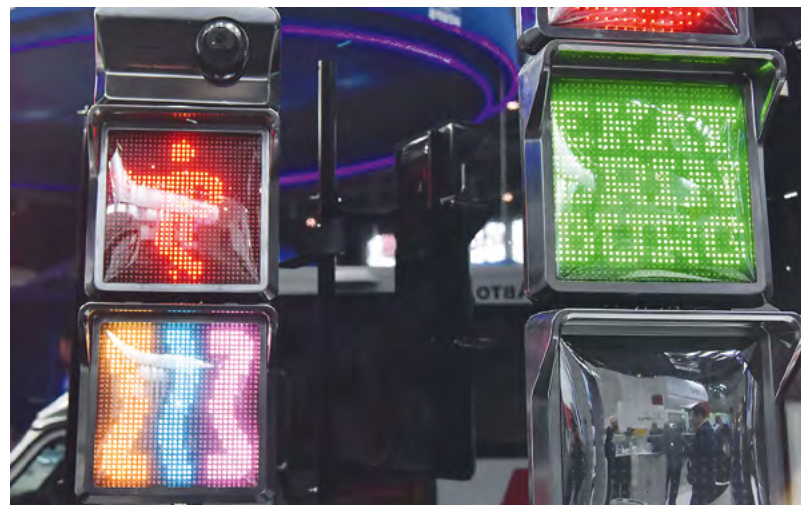
Наземное метро в Екатеринбурге избавит горожан от автомобильных пробок