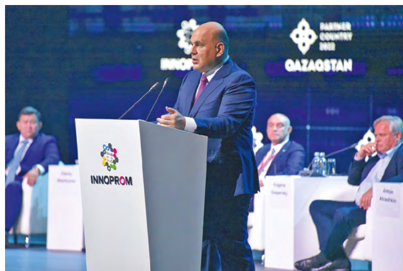
Михаил Мишустин заявил о дальнейшей поддержке опережающих темпов строительства трассы М12