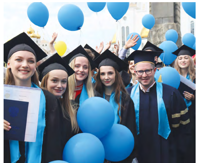
▲ УрГАУ выпустил более 650 молодых специалистов. 23 человека вошли в «Летопись лучших выпускников»