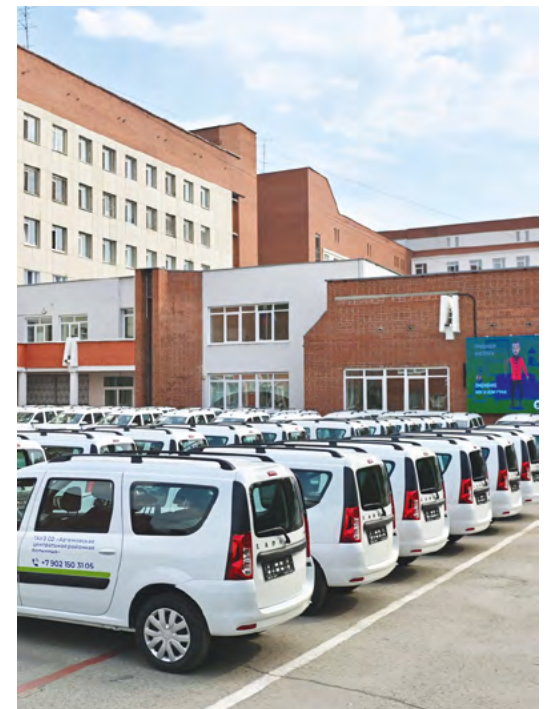
▲ 19 больниц Свердловской области получили 44 новых автомобиля. В этом году планируется купить еще 162 машины для медработников Фото: sve.рф

▼ Туристический поезд Екатеринбург — Алапаевск, курсирующий по «Императорскому маршруту», совершил сотый рейс Фото: sve.рф