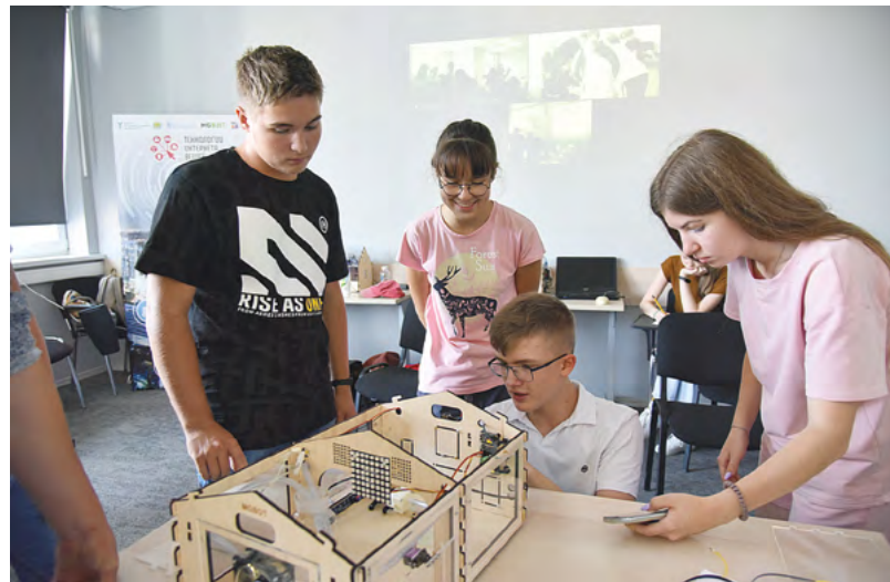
«Уральская инженерная школа» — это система ранней профориентации и подготовки инженерных кадров, которая реализуется начиная с дошкольного возраста.