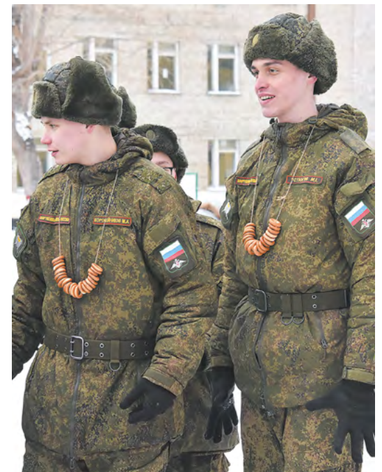
▲ Военнослужащие отдельной железнодорожной бригады Центрального военного округа организовали Масленицу для школьников.