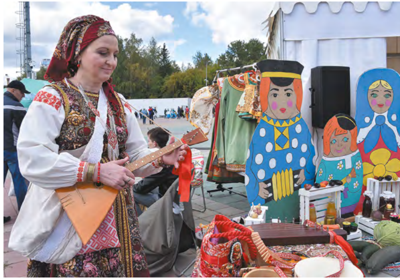
Закон о художественных промыслах на Среднем Урале был принят еще в 2013 году.

• активное сотрудничество с департаментом туризма региона.