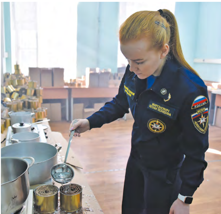
▲ Молодежь из ДНР познакомилась с работой свердловского Дома добровольцев и регионального штаба общероссийской акции #МыВместе.