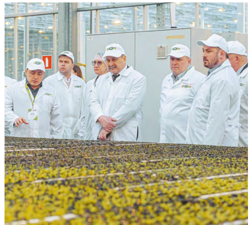
▲ Белорусские аграрии познакомилась с технологиями выращивания огурцов и томатов на комбинате «Тепличное» в поселке Садовом.