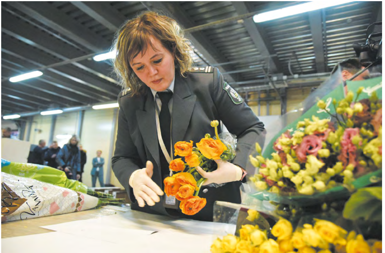
▲ В Свердловскую область перед 8 марта прибыли 233 тонны свежесрезанных цветов, выращенных в Эквадоре, Кении, Колумбии, Израиле и Эфиопии: уже приехало 25 грузовиков с розами, хризантемами, лилиями, гвоздиками и орхидеями.