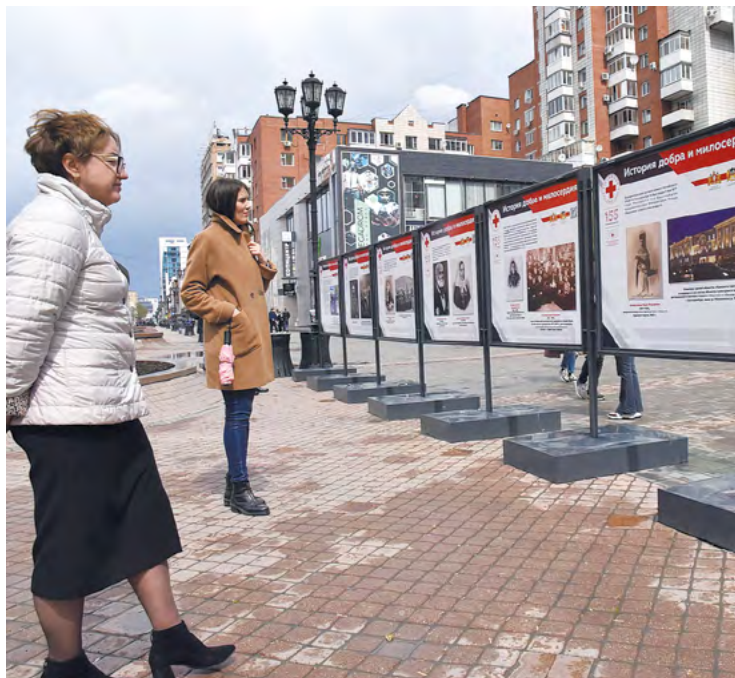
▲ Уличная фотовыставка в честь 145-летия свердловского Красного Креста открылась в уральской столице. Экспозиция разместилась на улице Вайнера, 346, возле регионального Минздрава. Фотоснимки передают богатую историю свердловских добровольцев и иллюстрируют современные акции помощи.