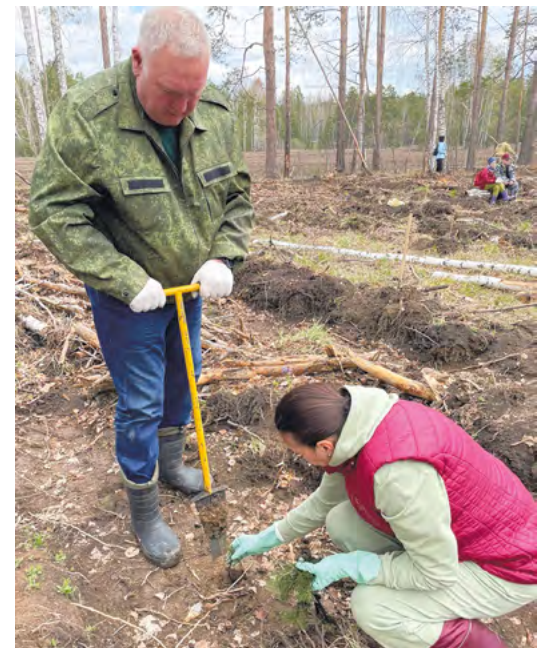
▲ На центральной площадке акции «Сад памяти» в Билимбаевском лесничестве высадили более 13 тысяч деревьев. Молодые ели появились здесь как дань памяти землякам, которые сражались на фронтах Великой Отечественной войны и героически трудились в тылу во имя Победы. Фото: Борис Ярков

▼ В Екатеринбурге открылся первый в России арт-объект «Стена памяти», посвященный людям, умершим от ВИЧ-инфекции. На открытии присутствовали уральцы, живущие с этим заболеванием и не скрывающие свой статус. Фото: Борис Ярков