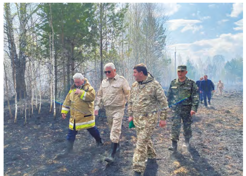
▲ Первый замгубернатора Свердловской области Алексей Шмыков провел выездную комиссию по чрезвычайным ситуациям в поселке Безречный под Березовском, где был зафиксирован крупный очаг торфяного пожара. Для борьбы с огнем переброшены дополнительные силы Авиалесохраны, МЧС и тяжелая техника.