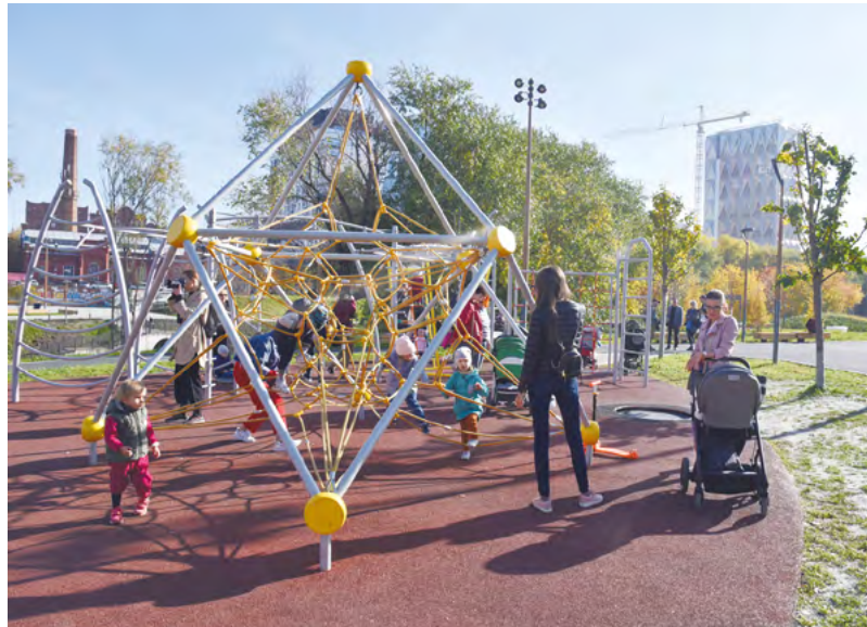
Всероссийское онлайн-голосование за объекты городской среды, которые благоустроят в 2023 году, завершится 30 мая

«И все еще может в корне измениться – все в руках жителей. Поэтому еще раз призываю всех неравнодушных уральцев, сделать свой выбор и проголосовать за понравившуюся площадку. Поверьте – повлиять на развитие городов, в которых живем мы,