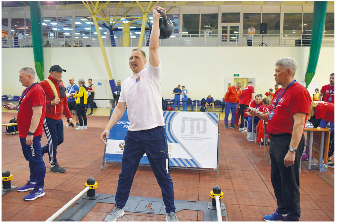
▲ В Верхней Пышме во Дворце спорта «УГМК» открылся Фестиваль ГТО среди трудовых коллективов, госслужащих и представителей муниципалитетов. На Урал приехали 42 сильнейшие команды, представляющие 37 регионов России.