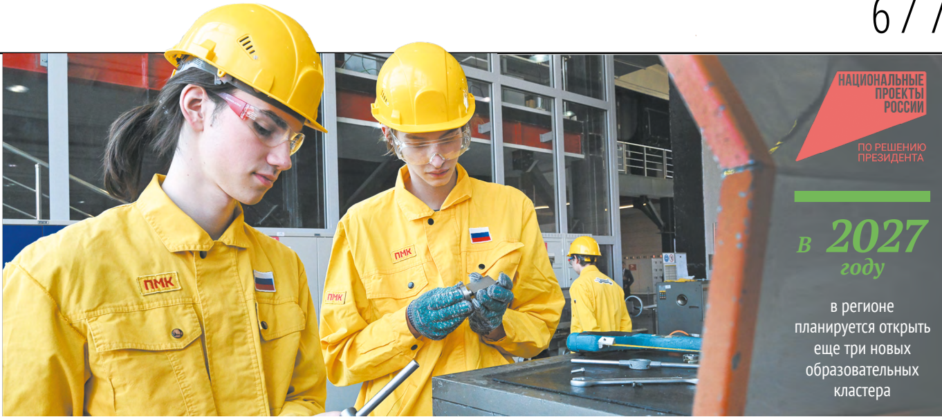
Студенты получают практические навыки и проходят производственную практику непосредственно на предприятиях-партнерах