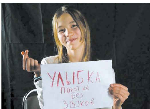
▲ Шесть призовых мест заняли свердловчане на XVI Международном фестивале социальной рекламы «Выбери жизнь». Победителями и призерами стали мультстудия «Оранжевый кактус», медиа студия «КИДСТУДИО», детский технопарк «Кванториум. Солнечный» и видеопродакшн «Горизонт».