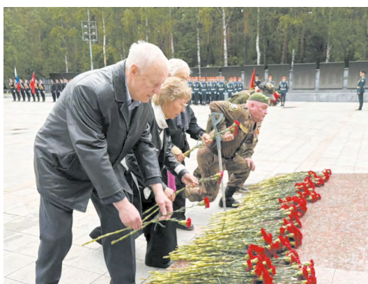
▲ Патриотическая акция «Эстафета памяти» в честь 85-й годовщины со дня начала Великой Отечественной войны началась на Широкореченском мемориале в Екатеринбурге.