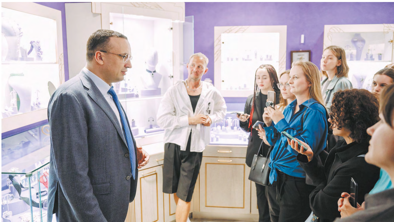
▲ Выставка-форум ювелирного искусства и бижутерии «Тонкие грани» пройдет в креативном кластере «Домна» в уральской столице в середине лета. По словам замгубернатора Дмитрия Ионина, здесь будет представлено порядка 30 российских брендов украшений.