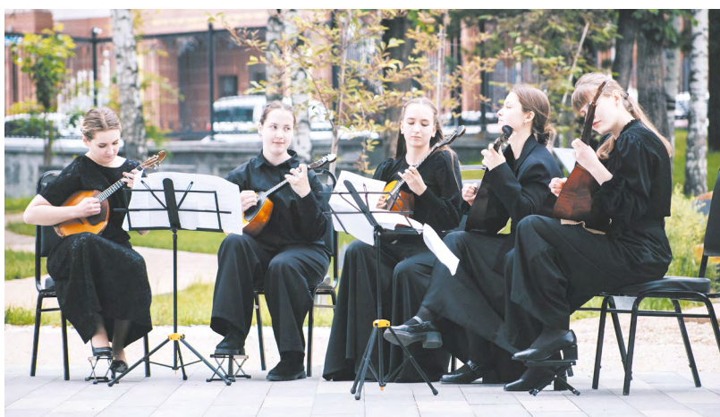
▲ С размахом отметили уральцы День русского языка и день рождения Александра Пушкина в Литературном квартале.