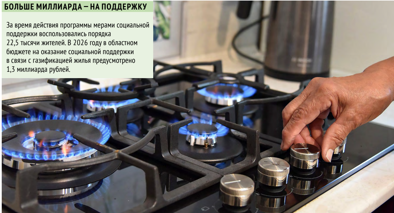
Благодаря программе догазификации десятки тысяч свердловчан уже получили возможность завести природный газ в свои дома!

За время действия программы мерами социальной поддержки воспользовались порядка 22,5 тысячи жителей. В 2026 году в областном бюджете на оказание социальной поддержки в связи с газификацией жилья предусмотрено 1,3 миллиарда рублей.