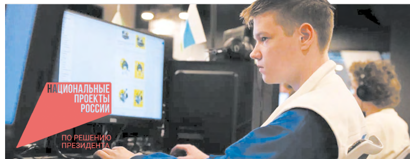
Профессиональная работа студентов на чемпионате – результат высокого уровня подготовки кадров в регионе и, конечно, собственного таланта

Золотую медаль в компетенции «Технологии информационного моделирования BIM» и бронзовую в основном зачете этой специализации завоевал студент Екатеринбургского монтажного колледжа