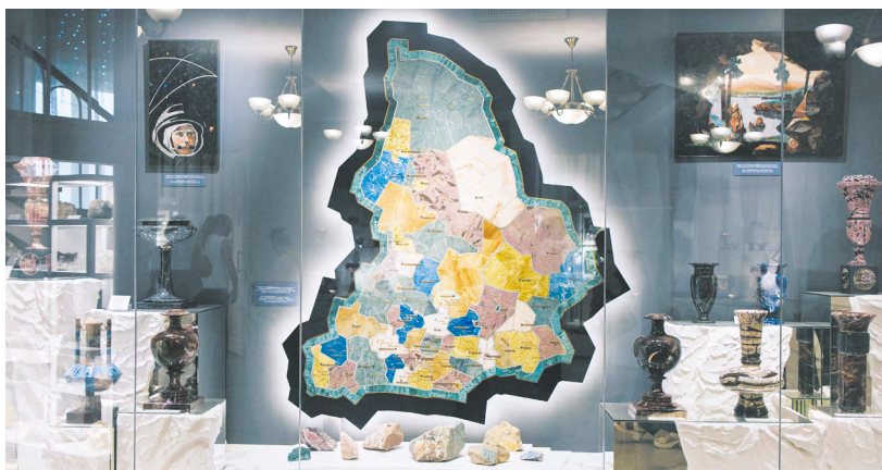
▲ В Музее истории камнерезного и ювелирного искусства открылась выставка «Россия в камне» – «Объект восхищения. Камнерезное искусство в коллекциях России». Проект приурочен к 300-летию уральского камнерезного дела.