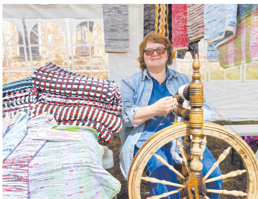
▲ «Троицкая ярмарка» прошла в селе Троицкое Каменского района. Фестиваль собрал мастеров, которые представили изделия, созданные в единственном экземпляре!