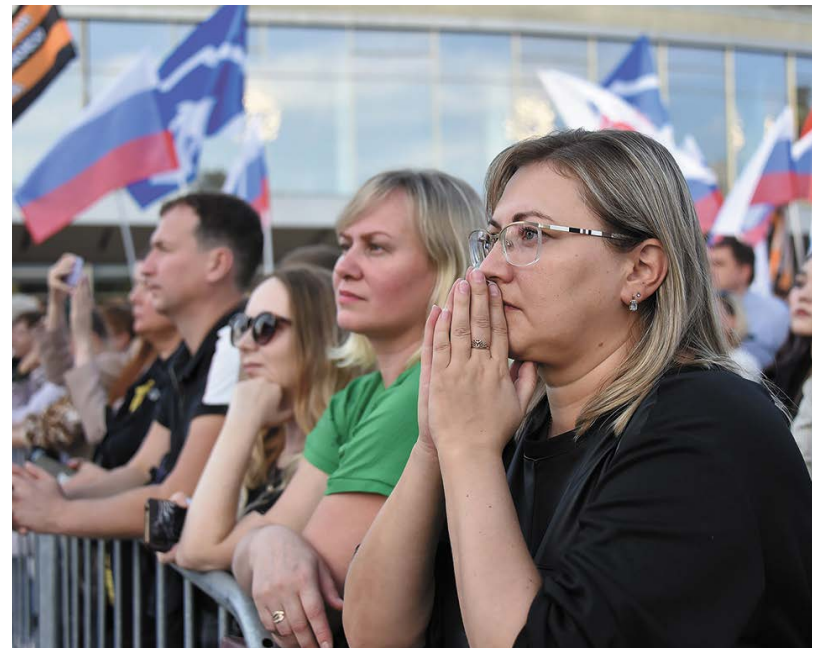
▲ В Екатеринбурге возле Дворца молодежи прошел митинг-концерт в поддержку жителей ДНР, ЛНР, Запорожской и Херсонской областей. Напомним, что там прошли референдумы, на которых решался вопрос о вхождении территорий в состав России.