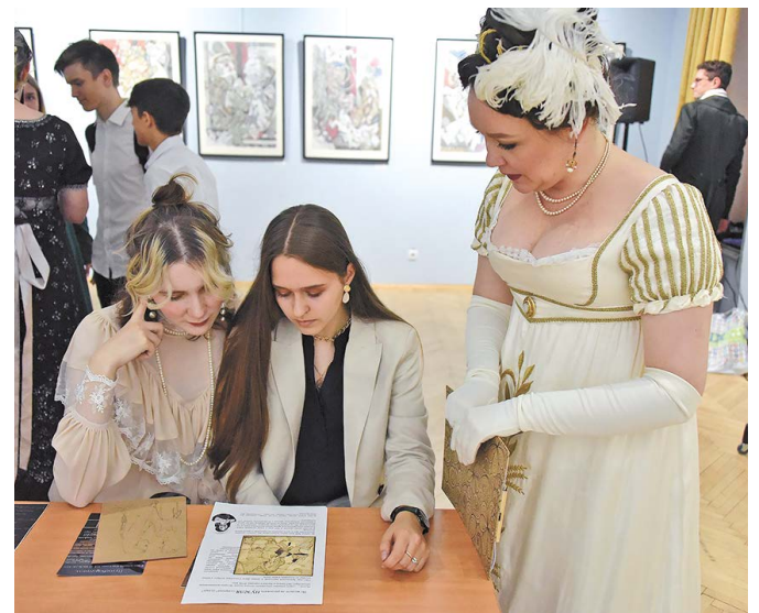
▲ В Областном краеведческом музее прошел Императорский бал. Его приурочили к закрытию выставки «Императорский Санкт-Петербург». Участниками бала стали пользователи «Пушкинской карты».