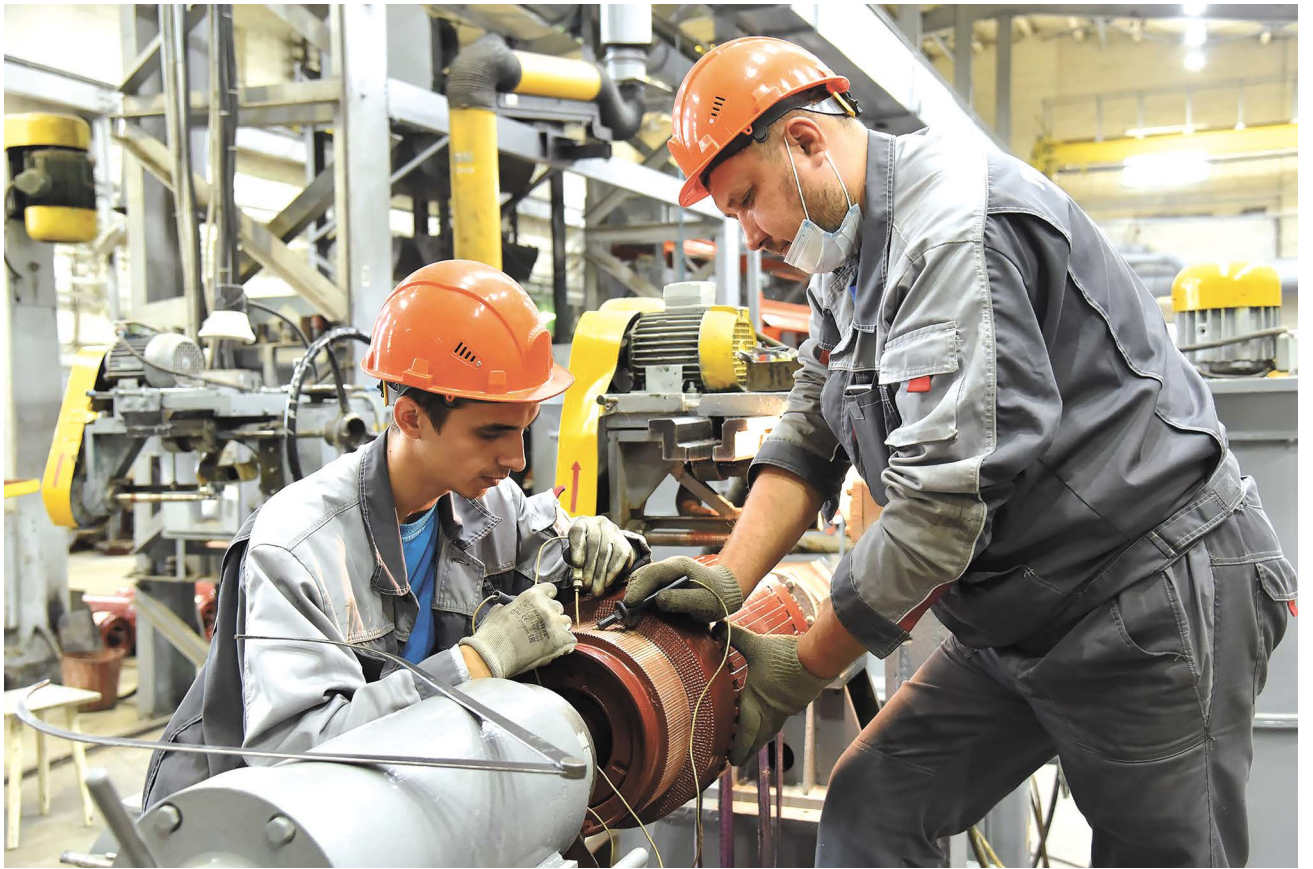
▲ В Асбесте на предприятии ремонтируют двигатели постоянного тока. К уральцам обращаются компании со всей России из Казахстана и Белоруссии. Несмотря на экономические и политические изменения, которые произошли в стране из-за санкций, на заводе почти на 12 процентов возросло количество заказов.