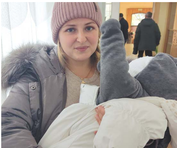
▲ В Свердловской области завершили работу зарубежные избирательные участки, организованные для голосования на референдуме, который проводили ЛНР, ДНР, Херсонская и Запорожская области. Исторический выбор сделали вынужденные переселенцы из разных районов. Многие приходили с детьми.