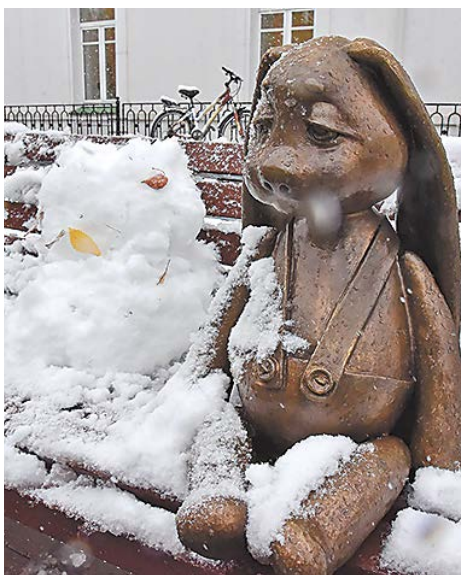
▲ В Екатеринбурге в понедельник после продолжительной теплой погоды выпал первый снег. До конца недели существенного потепления на Среднем Урале синоптики не ожидают. Температура воздуха будет в среднем на 4-6 градусов ниже нормы.