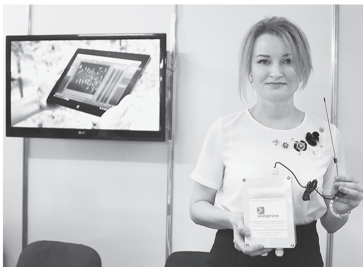
Устройство размером с калькулятор осуществляет мониторинг общедомовых приборов учета.