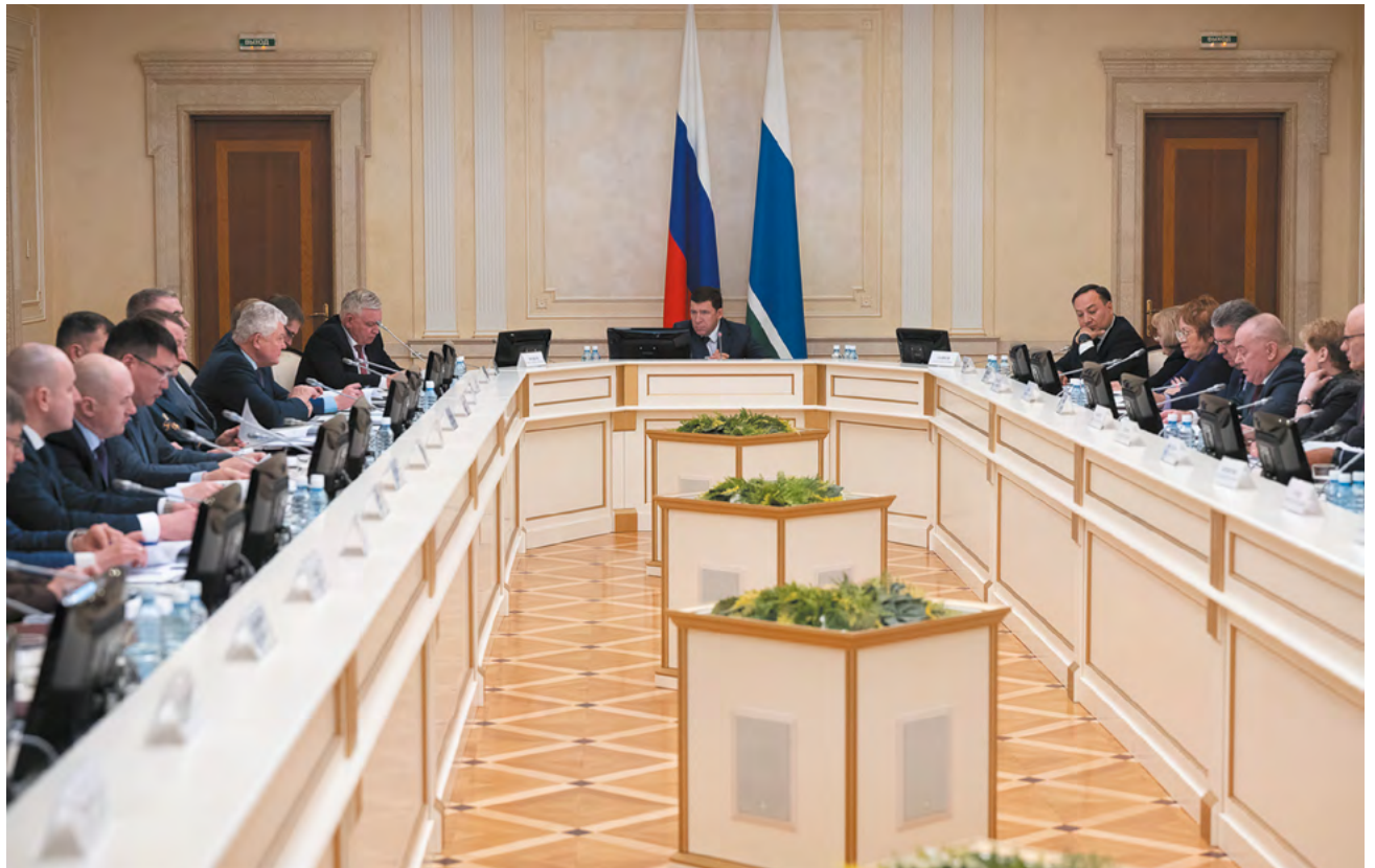
▲ Евгений Куйвашев на заседании региональной антинаркотической комиссии призвал уделить особое внимание информационной и разъяснительной работе, лечению и реабилитации наркозависимых, выявлению и пресечению каналов распространения наркотических средств.