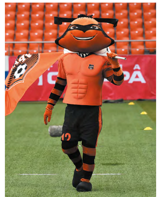
▲ Прервалась беспроигрышная серия «шмелей» из 16 игр — «Урал» уступил московскому «Динамо».