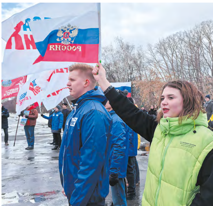
▲ В Екатеринбурге студенты вузов и колледжей провели флешмоб в честь воссоединения Крыма с Россией.