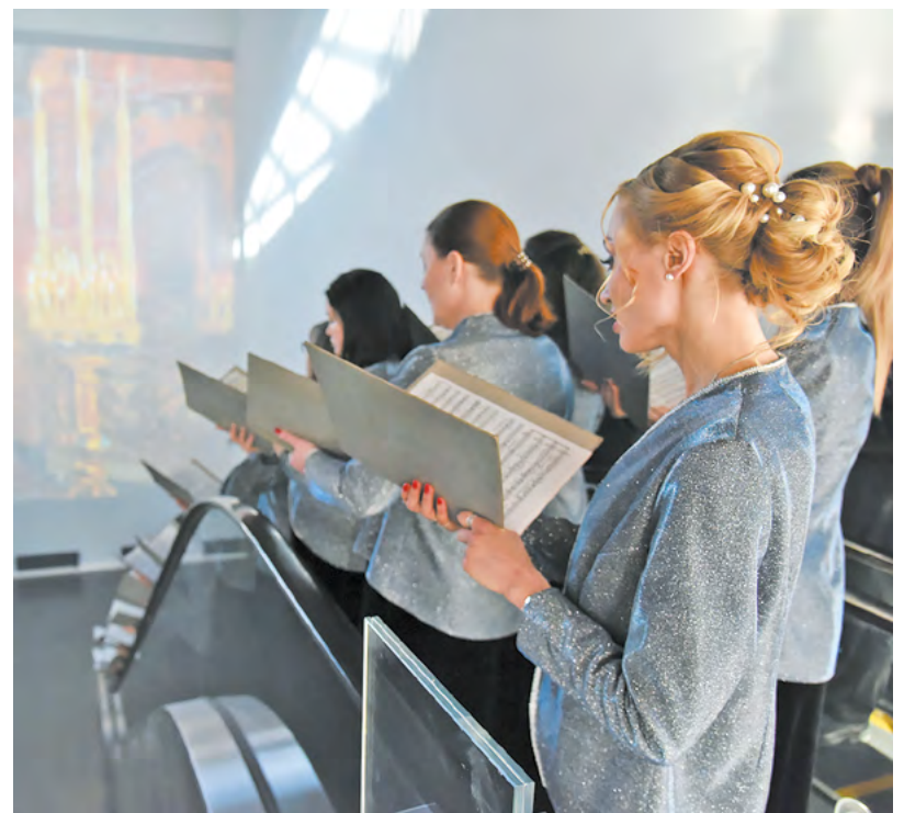
▲ Симфонический хор Свердловской филармонии презентовал фестиваль «Рахманинов. Зримая музыка» на ступенях эскалатора центра «Эрмитаж-Урал».