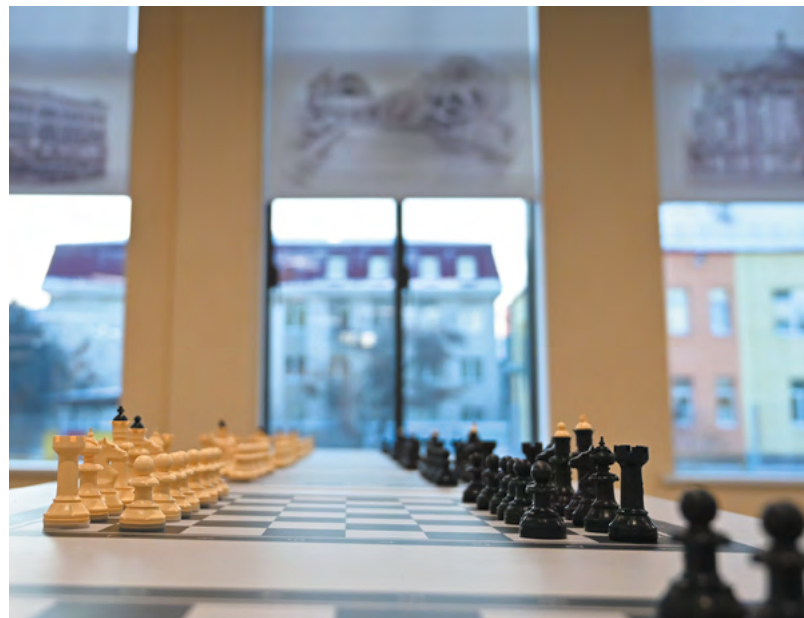
В планах на Год педагога – решение социальных проблем учителей, проведение конкурсов, форумов, строительство новых школ.

дополнительная поддержка от государства. Помимо выплат и специальных программ нужно менять подход к обучению будущих врачей. Так, в этом году в школах Свердловской области будут открыты новые медицинские классы. Сейчас такие классы работают в 22 учебных заведениях, а к 2025 году их количество должно достичь 50. Таким образом, в регионе появится целая сеть школ, где дети будут углубленно изучать химию и биологию.