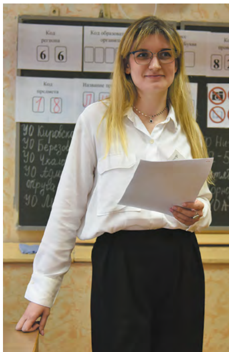
▼ В Свердловской области успешно стартовал досрочный период сдачи ЕГЭ.