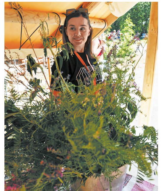
▲ В Сысерти началось «Лето на заводе» — в креативном кластере на территории старинного завода Турчаниновых-Соломирских каждые выходные ждут гостей.

▼ День соседей объединил более 18 тысяч уральцев в 52 городах и поселках.