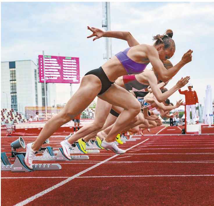
▲ Стадион «Калиинец» признан Всероссийской Федерацией легкой атлетики одним из лучших в стране.