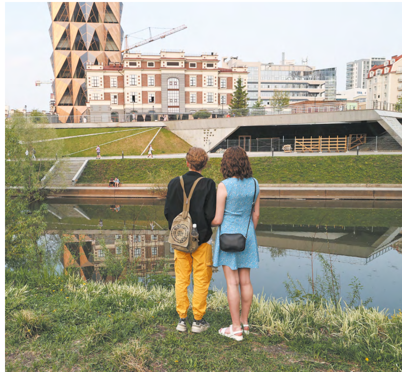
Эксперты называют факторы, влияющие на снижение рождаемости: урбанизация и отсутствие необходимости в ребенке.