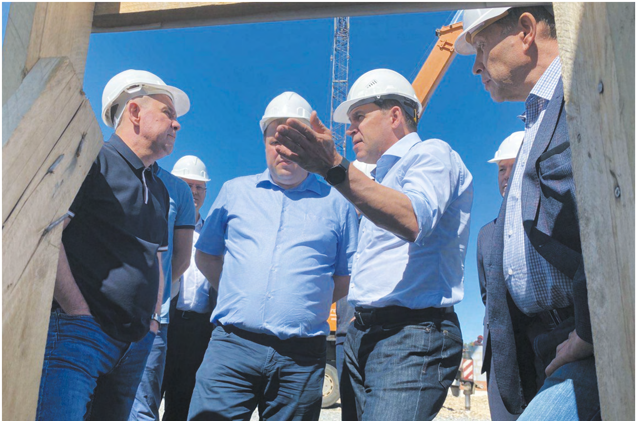
▲ Евгений Куйвашев, как и обещал жителям Сосьвы, вновь приехал в поселок, чтобы проконтролировать строительство домов для погорельцев. Фото: све.рф

Всего в рамках социальной газификации в области уже построено 628 километров газопроводов. До конца 2024 года планируется создать техническую возможность для подключения более чем 71 тысячи домовладений. При этом техническая возможность уже создана для 57,5 тысячи домов, что составляет почти 82 процента от плана-графика. Фото: све.рф