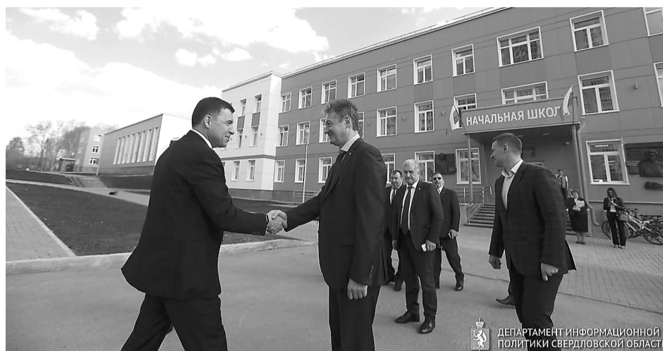
Верхняя Пышма по региональной программе до 2024 года получит средства на строительство и реконструкцию школ №№1, 3, 4, 25.

В школе созданы интерактивная лаборатория, полигон для подготовки к соревнованиям по робототехнике, дорожный перекресток для изучения пра-