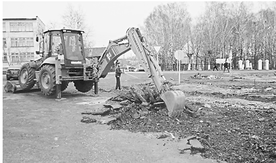
В Ачите, как и в других городах региона, началось благоустройство площади.

Федеральные гранты пойдут на благоустройство территорий