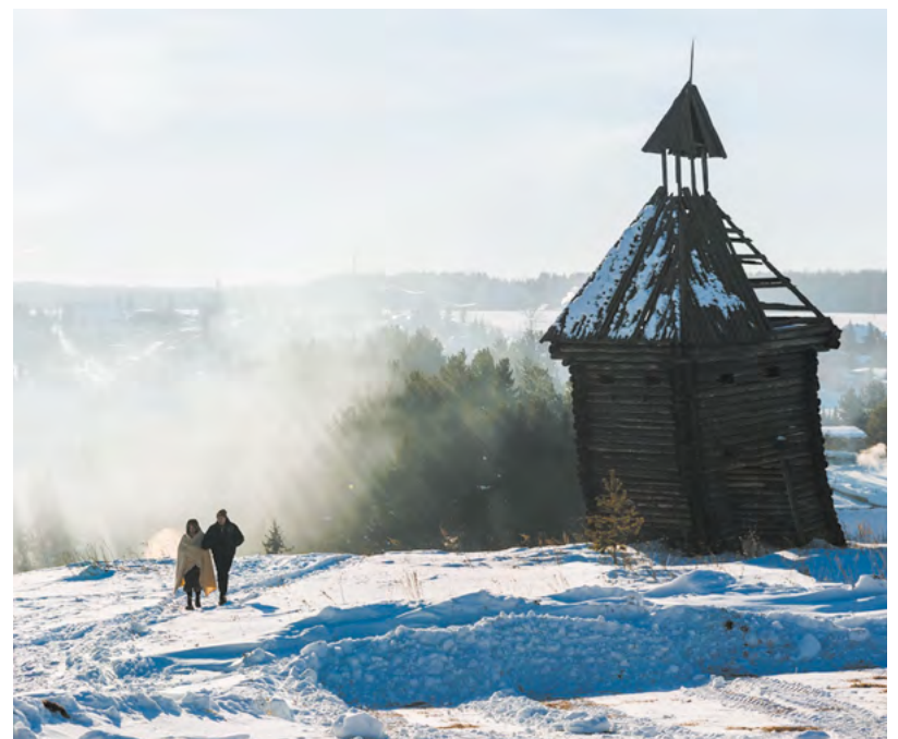
▲ В деревне Каменка на Чусовой работает центр «Ключ-Камень»: туристы могут попробовать уральские блюда и побывать в декорациях к фильму «Угрюм-река».