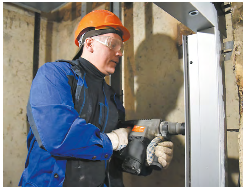
Программа по замене лифтов в Свердловской области признана лучшей в стране

Губернатор Евгений Куйвашев взял ситуацию под личный контроль, принял решение о выделении городу 51 миллиона рублей из резервного фонда и поручил правительству искать дополнительные возможности для устранения проблемы. Выходом вновь стало концессионное соглашение. На сегодняшний день в сфере ЖКХ действует уже более 50 концессий, помогающих решать инфраструктурные проблемы в Екатеринбурге, Сысерти, Первоуральске и других городах области.