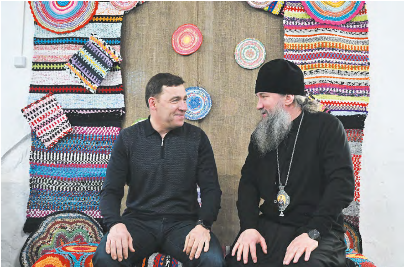
▲ Евгений Куйвашев и митрополит Екатеринбургский и Верхотурский Евгений в Крещение посетили святочную ярмарку в Актайском ските Свято-Николаевского монастыря.

Электричка может перевозить 404 пассажира, до февраля на проезд по маршруту от Екатеринбурга до Бокситов будет действовать специальный тариф — 883 рубля.