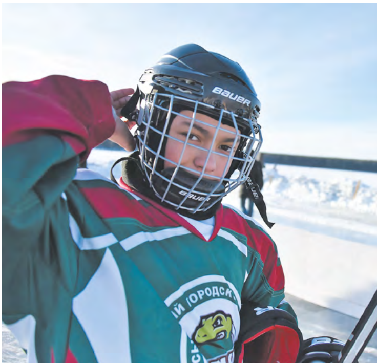
▲ «Студеный лед» — возрожденная Ночной хоккейной лигой традиция: игра на льду замерзшего пруда.