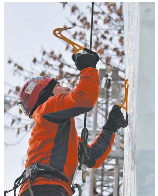
▲ Городок на площади 1905 года в Екатеринбурге завершил работу фестивалем «Ледовый шторм».

▼ Уральские аграрии при содействии Центра поддержки экспорта отгрузили в Китай около 10 тысяч тонн семян льна.