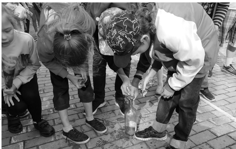
Дети знают: бумага — лучшая альтернатива пластика

В самом начале все дружно поделились на две команды, каждая имела девиз, свой знак окружающей среды, который вместе и нарисовали. Задания были разные, одно из них – «Живая вода». Из него можно узнать, что бумага – лучшая альтернатива пластика. Сворачиваешь из бумаги кулёк, и он легко удерживает воду. Задача была общими усилиями из полной бутылки с водой перелить в пустую. Конкурс учит детей бережно обращаться с водой – когда каждая капля на