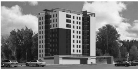
Общежитие реконструируют под жилой дом

В Нижнетуринском ГО активно действует программа по обеспечению жильем нуждающихся. Так, местные власти заключили контракт на реконструкцию пустующего здания бывшего заводского общежития. После окончания работ здесь появятся 64 квартиры,