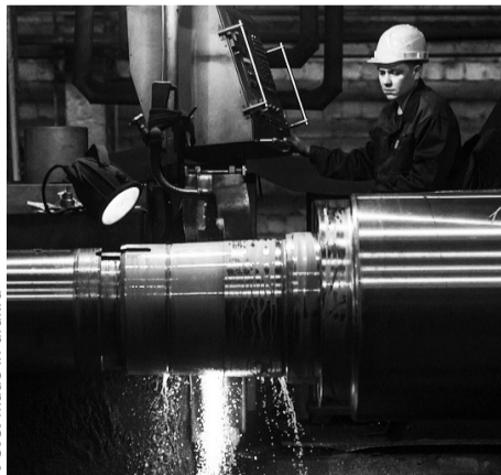
КЗПВ — единственный в стране завод, который может производить валки весом более 50 тонн

Сложно назвать отрасль промышленности, где не применяется металл и изделия из него, для производства которых активно используется прокатный стан. Прокатные валки являются рабочей частью прокатного стана. Металлургические предприятия сегодня предъявляют достаточно высокие требования к оборудованию, и кушвинский завод готов конкурировать в выпуске качественной продукции. Компетенций