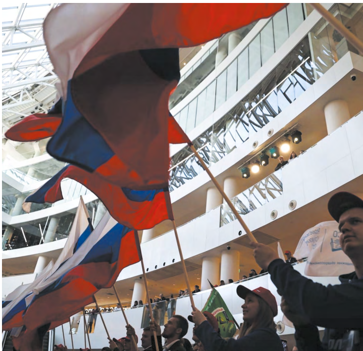
▲ В Ельцин Центре добровольцам и общественникам передали государственные флаги России.