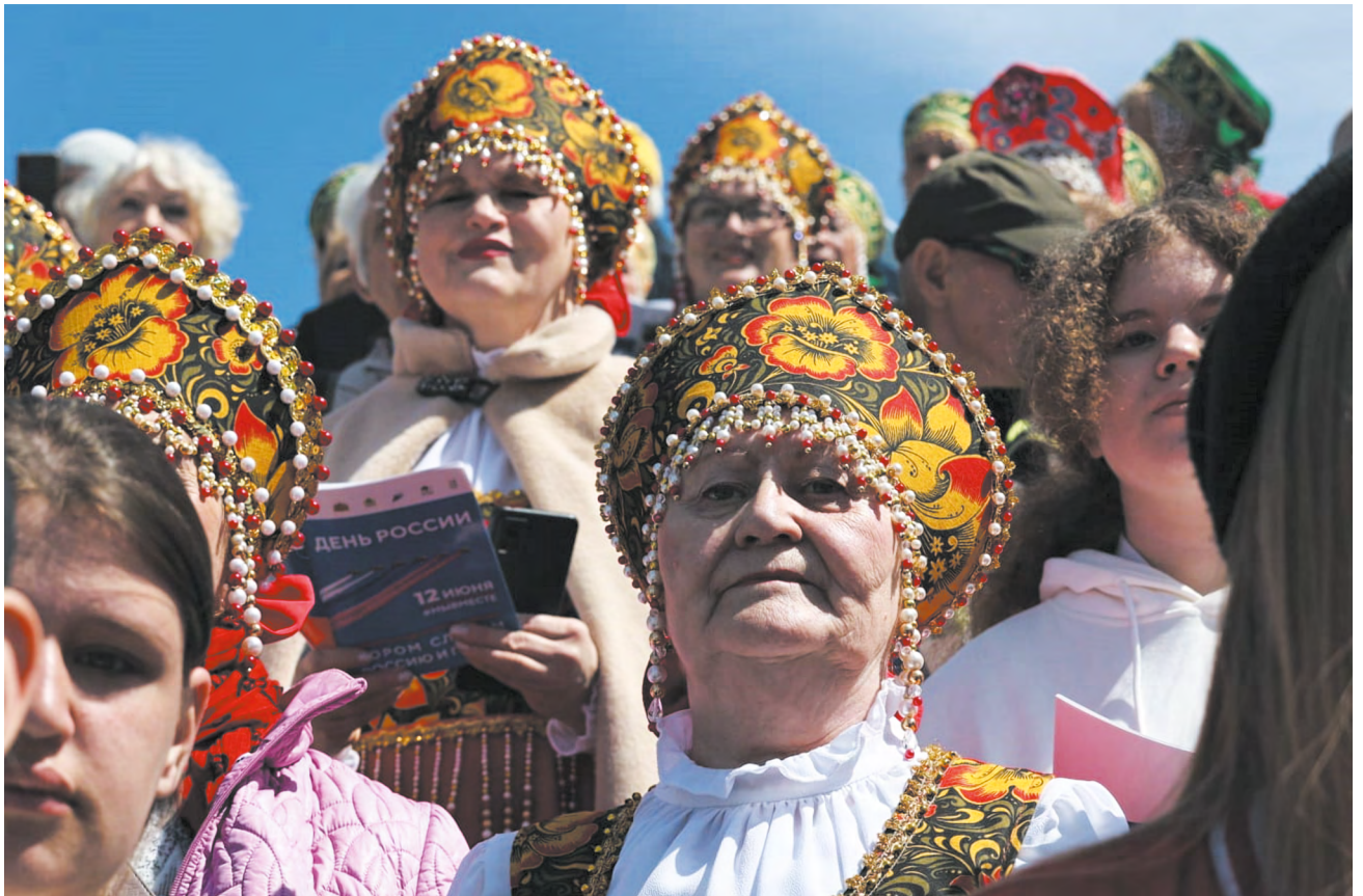
▲ Тысячи уральцев в сопровождении духового оркестра исполнили гимн России и популярные песни. Традиционная акция «Хором славим Россию и город» в девятый раз прошла в Историческом сквере Екатеринбурга.

«Мы говорим о появлении программы лояльности — системе скидок практически во всех магазинах, кинотеатрах, фитнес-центрах — тех местах, которые любят посещать студенты. И это серьезно удешевляет жизнь студентов в Екатеринбурге. Мы будем поощрять студентов-отличников. И эта программа будет распространяться на всю Свердловскую область. Уверен, что через пару-тройку лет мы всех студентов из Москвы к нам переташим», — подчеркнул Евгений Куйвашев.