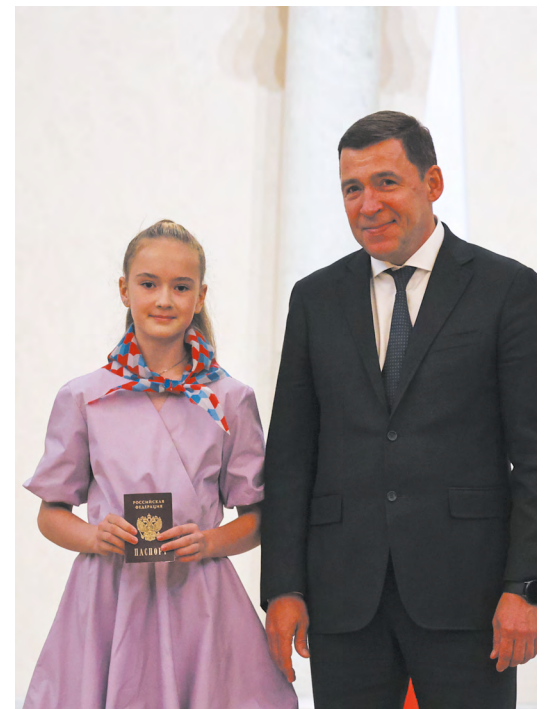
▲ Евгений Куйвашев вручил паспорта десяти лучшим уральским школьникам.

▼ Министру высшего образования и науки РФ Валерию Фалькову презентовали перспективные наработки уральских ученых.