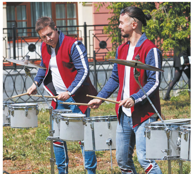
▲ В Екатеринбурге в преддверии музыкального марафона «Безумные дни» барабанщики коллектива «Чувство ритма» провели зарядку.