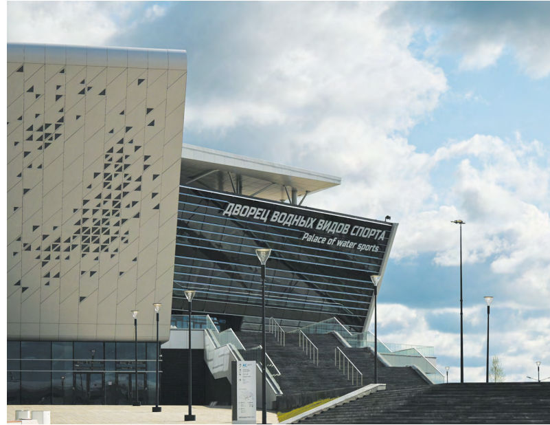
За год в Свердловской области появились 382 новых спортивных объекта.

Что важно, проект многогранен и не ограничивается лишь школой. Например, для самых активных ребят оператор проекта «Спортивная школа по каратэ» ежегодно организует церемонию награждения. В конце 2022 году десять лучших спорт-лидеров в качестве поощрения посетили «Планетарий» музейного комплекса УГМК и баскетбольный матч чемпионата России.