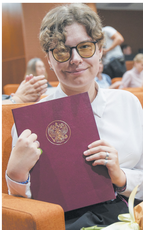
▼ Школьники и педагоги получили губернаторскую премию.