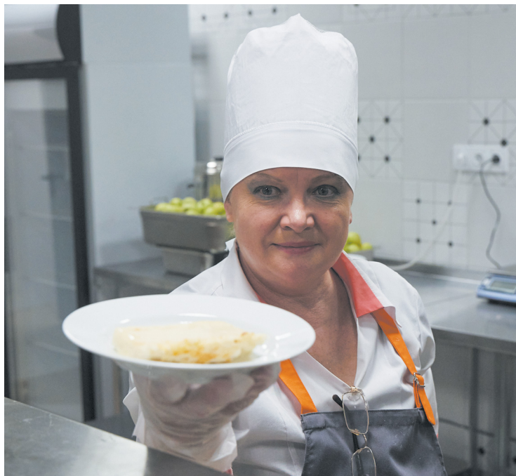
▲ Более 500 тысяч свердловских школьников обеспечены горячим питанием.