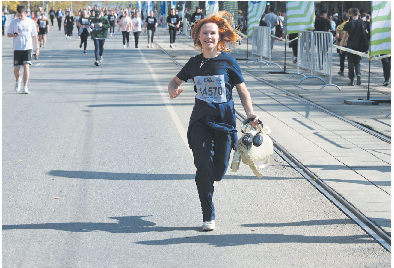
▲ В Екатеринбурге больше 20 тысяч человек приняли участие в «Кроссе нации».