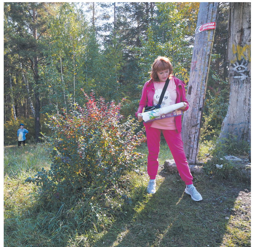
▲ В Екатеринбурге прошла юбилейная «Майская прогулка».