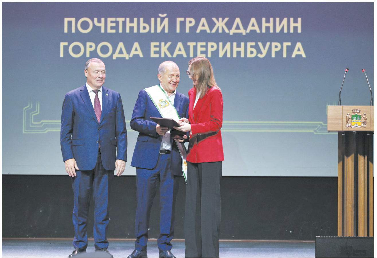
▲ На торжественном приеме, посвященном дню основания Екатеринбурга, награды получили заслуженные горожане.