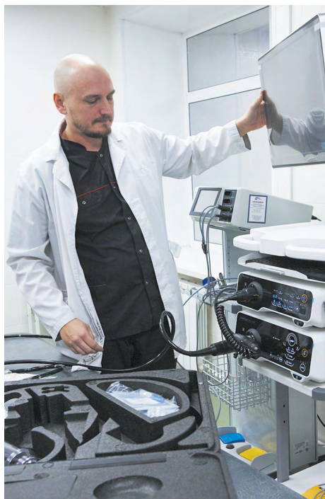
▼ Центр амбулаторной онкологической помощи открылся на базе ЦГБ №7 Екатеринбурга.