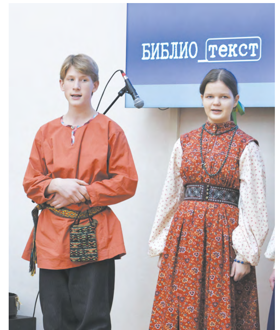
▲ Форум «Библионнале на Урале» прошел в областной универсальной научной библиотеке им. Белинского.