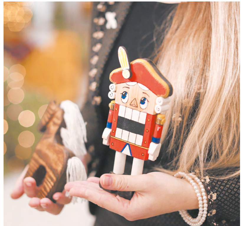
▲ Игрушки семейной мастерской «Животвори» из Верх-Нейвинска представляют Средний Урал на выставке «Россия».