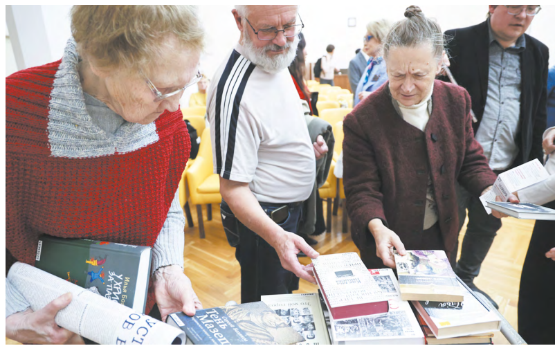
Региональная программа «Старшее поколение» была запущена в 2012 году.

ной грамотности до краеведения и социального туризма. За десять лет работы школы ее закончили около 300 тысяч человек. Кстати, занятия в школе оказались настолько актуальными, что в период пандемии ученики были готовы получать знания онлайн. Организаторы перевели мастер-классы в формат вебинаров, и у пожилых уральцев появился дополнительный стимул лучше изучать информационные технологии.