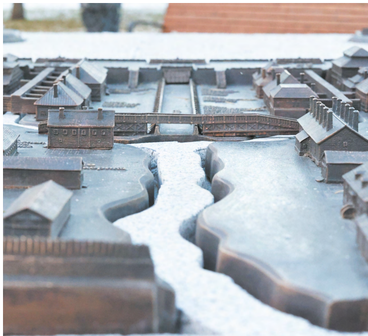
▲ Макет Екатеринбурга XVIII века, отлитый в бронзе, установили в Историческом сквере.