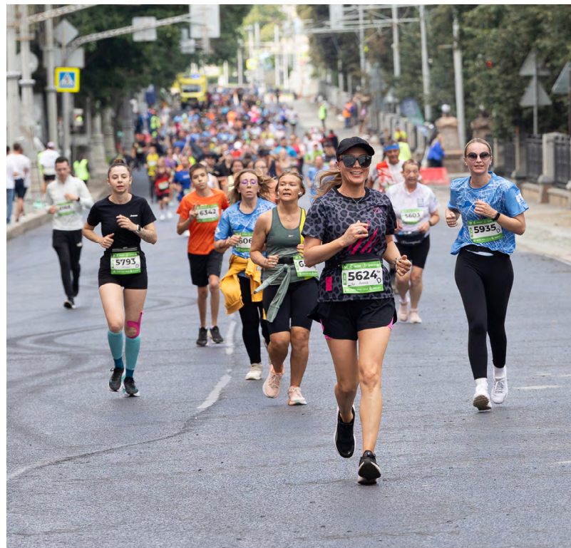
Ежегодно в Свердловской области проводится около 19 тысяч физкультурных и спортивных мероприятий.

новый порядок, который позволит привлечь профессиональных, квалифицированных специалистов.