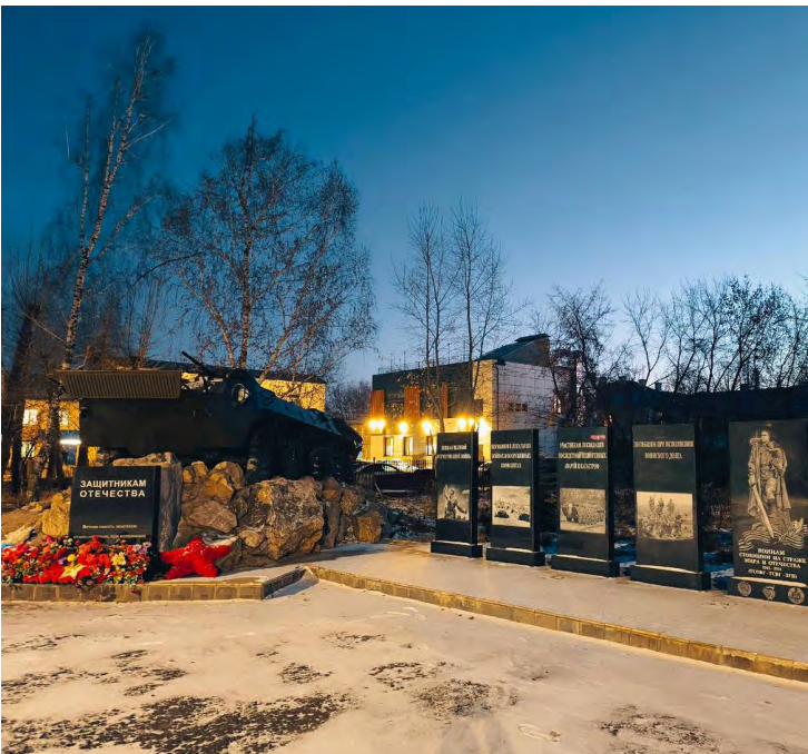
▲ В Богдановиче по инициативе жителей преобразуется мемориальный комплекс «Аллея Славы».

▼ Завершены масштабные ремонтные работы внешнего купола екатеринбургского цирка.