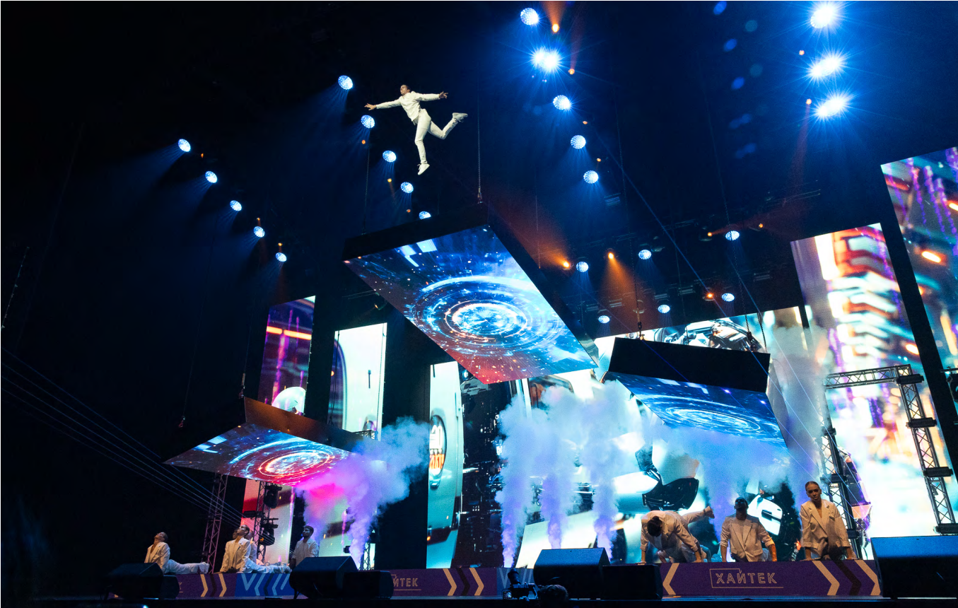
▲ В Екатеринбурге завершился чемпионат высокотехнологичных профессий «Хайтек», на котором свердловчане завоевали 11 медалей.