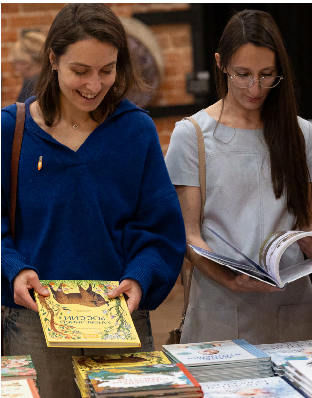
▲ В «Домне» прошел книжный маркет – гаражная ярмарка издательства МИФ.