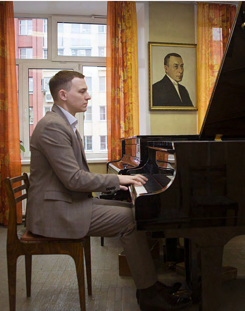
Момент затишья перед тем, как руки музыканта обрушат на класс всю мощь и лирику рахманиновских аккордов!

Здесь не только учат музыке – здесь живут ею с первого класса. За знаменитыми стенами уральской спецшколы скрывается мир, где гаммы и этюды гармонично сочетаются с алгеброй и литературой, а финальный 12-й год обучения становится трамплином в большую профессиональную жизнь. Уникальная методика погружения объединяет общее образование (начальное и основное) с профессиональным музыкальным обучением.