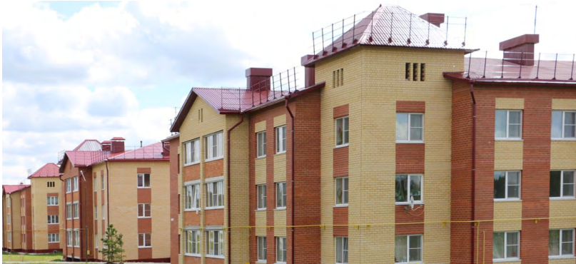
На смену аварийным баракам приходят современные дома, в которых сама атмосфера располагает к счастливой жизни

— С конца этого года приступим к расселению домов, признанных аварийными после 1 января 2017 года, — подчеркнул Денис Паслер, отметив, что на реализацию новой региональной программы в 2025–2026 годах выделены 790,6 миллиона рублей, из них 282,7 миллиона — средства Фонда развития территорий, 500 миллионов — областной бюджет, 7,9 миллиона — местные бюджеты. Реализация программы начнется с 12 муниципалитетов, в том числе семи опорных городов — Асбеста, Дегтярска, Ирбита, Нижнего Тагила, Качканара, Кушвы и других. В результате 434 человека переедут из 28 аварийных домов общей площадью 7,8 тысячи квадратных метров. По словам губернатора Свердловской области, регион берет на себя повышенные обязательства. Вместо 28 запланированных в следующем году будут расселены 90 домов. «Продолжаем системно решать задачу по созданию безопасных и комфортных условий для жизни уральцев», — добавил глава Среднего Урала.