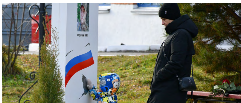
Имена воинов-железнодорожников, павших на СВО, увековечены на аллее

Много лет назад с этого места отправился на фронт бронепоезд «Красноуфимский железнодорожник», собранный в местном депо и потом воевавший как раз в тех местах, где фронт для наших бойцов развернулся сегодня. А теперь здесь раскинулась Аллея славы воинам-железнодорожникам, погибшим в ходе специальной военной операции.