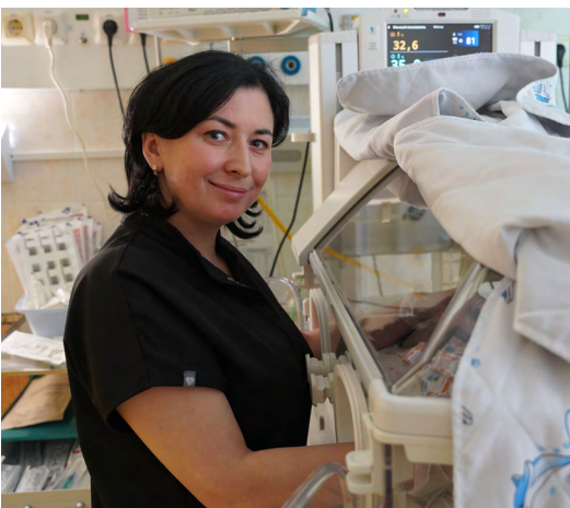
▲ Современные технологии и любовь к детям помогли медикам выходить 1,2 тысячи недоношенных малышей