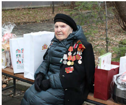
▲ Сто лет мужества и жизни: участница Великой Отечественной войны из Екатеринбурга отметила юбилей