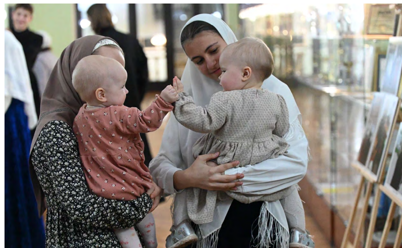
▲ Памяти верности: в Екатеринбурге прошел вечер, посвященный Боярыне Морозовой