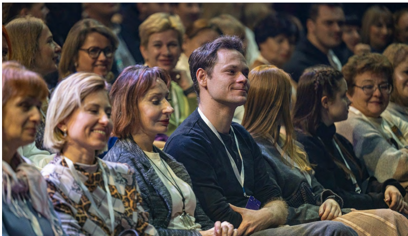
▲ В Новоуральске зажегся «Луч»: стартовал первый театральный фестиваль