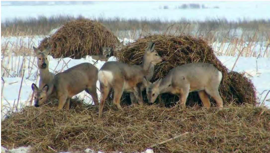
Поголовье копытных в Свердловской области увеличивается благодаря усилиям работников охотхозяйств. Но есть у этого и обратная сторона: молодежь в поисках пищи все чаще выходит к людям

• ЕСЛИ ВСТРЕТИЛИСЬ С СОХАТЫМ Никто не застрахован от неожиданной встречи, поэтому строгое соблюдение скоростного режима и повышенная бдительность водителей на опасных участках – главные условия безопасности. Эксперты объясняют: если встреча с животным все же произошла, важно сохранять спокойствие. Правильнее всего в та-