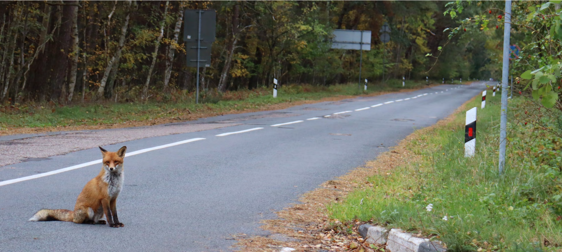
Рыжие красавицы всегда привлекают внимание людей, но многие забывают, что это дикие звери, которые могут быть смертельно опасны!

10 лосей и 12 косуль погибли по вине водителей на дорогах Свердловской области за две последние недели весны 2025 года. В начале июня зафиксирована гибель 9 косуль и 3 лосей, а с 29 сентября по 5 октября в результате 12 ДТП на дорогах региона погибло еще 11 диких животных На территории детского сада № 39 в Екатеринбурге летом 2024 года был обнаружен мертвый лисенок. Лабораторные анализы подтвердили страшное: у животного было бешенство. После этого в районе частично введен карантин, он затронул 27 жилых домов.