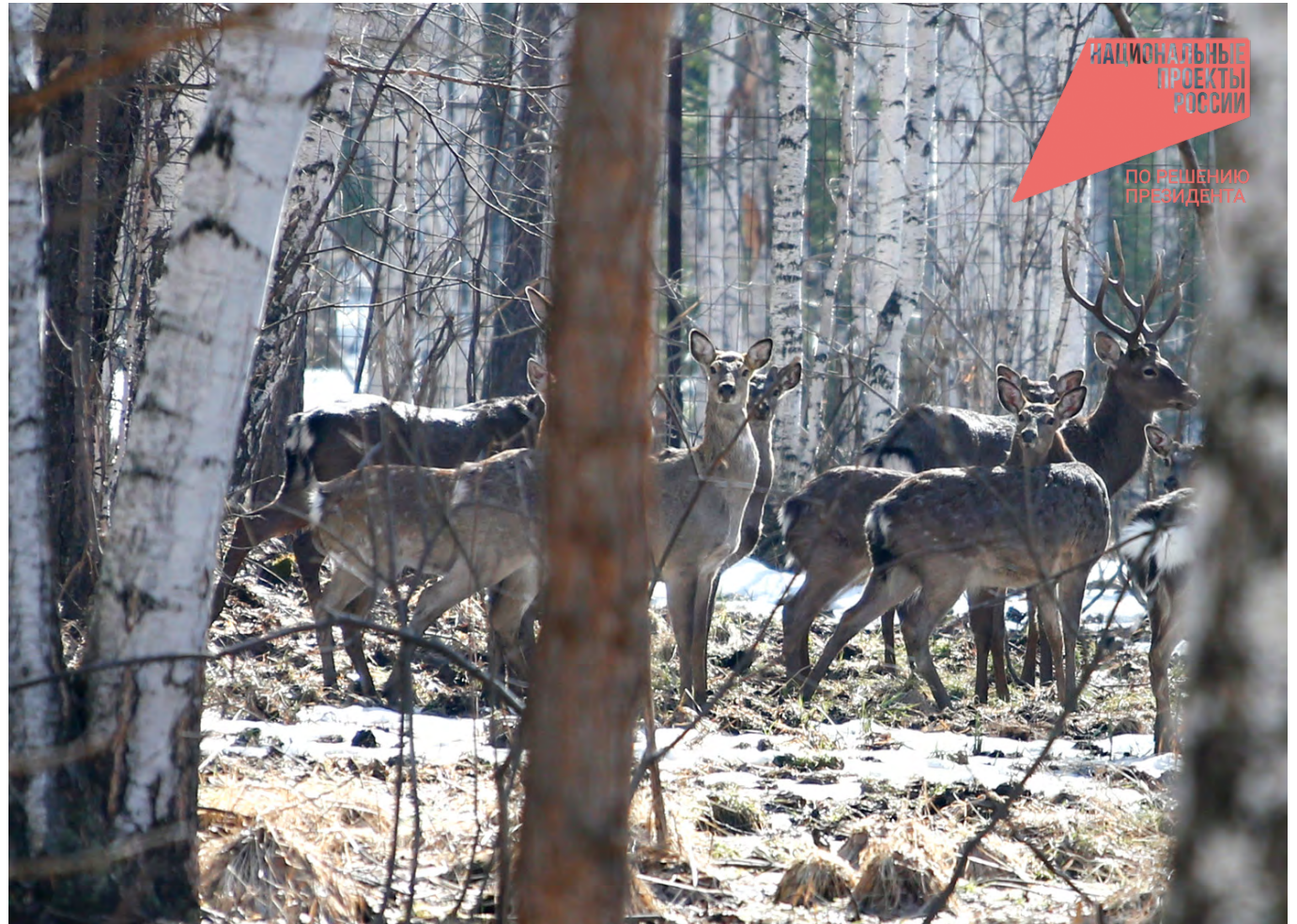
Встречи с рогатыми обитателями уральских лесов могут произойти тогда, когда этого меньше всего ожидаешь. На автомобильных трассах это может обернуться непоправимой трагедией...

В октябре уральский поселок Сагра оказался во власти стада диких кабанов. Животные, потеряв природную осторожность, вели себя как полноправные хозяева: они то и дело паслись на окраинах са-