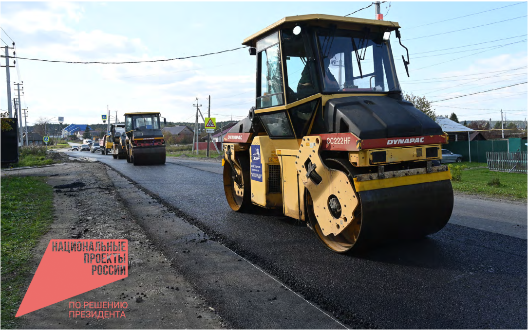
В регионе, где дорожная сеть — одна из крупнейших в стране, и внимание содержанию уделяется повышенное!