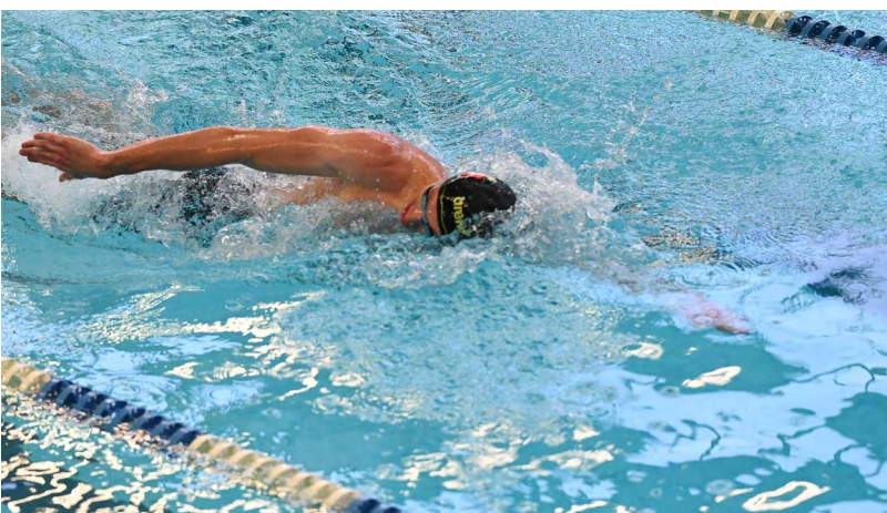
▲ От брасса до вольного стиля: более пятисот пловцов со всего Урала приехали в Екатеринбург побороться за звание лучших