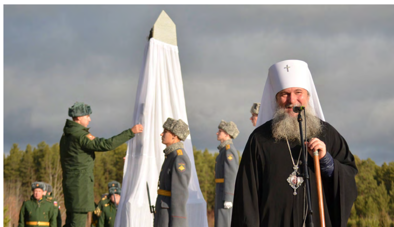
Митрополит поблагодарил детей погибших воинов за то, что стараются быть похожими на своих отцов

Больше двух сотен человек – родные погибших бойцов, военные, представители духовенства, администрации, общественники, горожане – собрались в начале ноября в почетном секторе Северного кладбища Берёзовского. Под гимн России и оружейные залпы почетного караула была открыта памятная стела землякам, погибшим в ходе специальной военной операции.