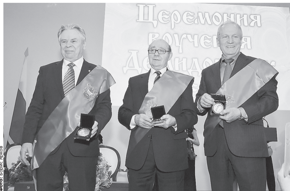
Валерий Тишков (на фото слева) считает, что гуманитарий, если он хочет что-то изменить к лучшему, не может дистанцироваться от происходящих событий в обществе.

Валерий Александрович — научный руководитель Института этнологии и антропологии РАН (который он более четверти века возглавлял), директор учебно-научного Центра социальной антропологии РГГУ, самый цитируемый в стране этнолог и историк, академик-секретарь Отделения историко-филологических наук РАН, яркий политик (в 1992 г. федеральный министр, председатель Государственного комитета по делам национальностей) и общественный деятель (в 2006—2010 гг. член Общественной палаты РФ, в настоящее время член президиума Совета при Президенте РФ по межнациональным отношениям). Он автор более чем 400 научных работ, в том числе 12 монографий, многие из которых получили большой резонанс и переведены на иностранные языки, в частности «Этничность, национализм и конфликты в СССР и после его распада» (1997), «Общество в вооруженном конфликте. Этнография чеченской войны» (2003). Под его редакцией и при активном авторском участии вышло более пятидесяти книг, в том числе фундаменталь-