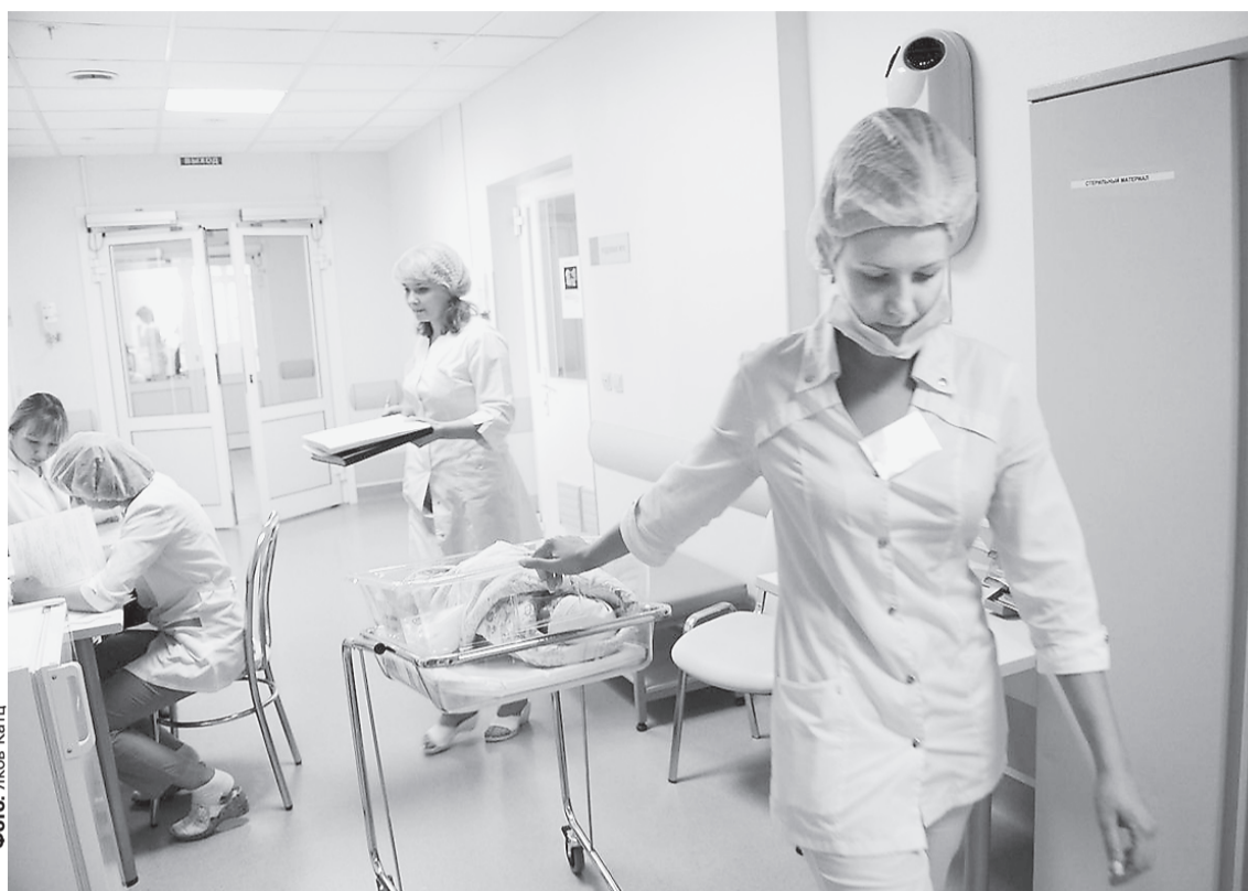
В среднем эффективность процедуры ЭКО по результатам прошлого года составляет 31%.

Заместитель председателя областной комиссии по отбору и направлению пациентов с бесплодием, проживающих на территории