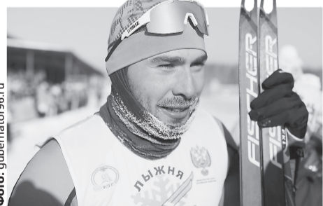
Антон Шипулин излучал заряд патриотизма.

Глава региона открыл соревнования выстрелом из пушки. Куйвашев принял участие в массовом забеге, а Шипулин, ставший на этой неделе двукратным от-