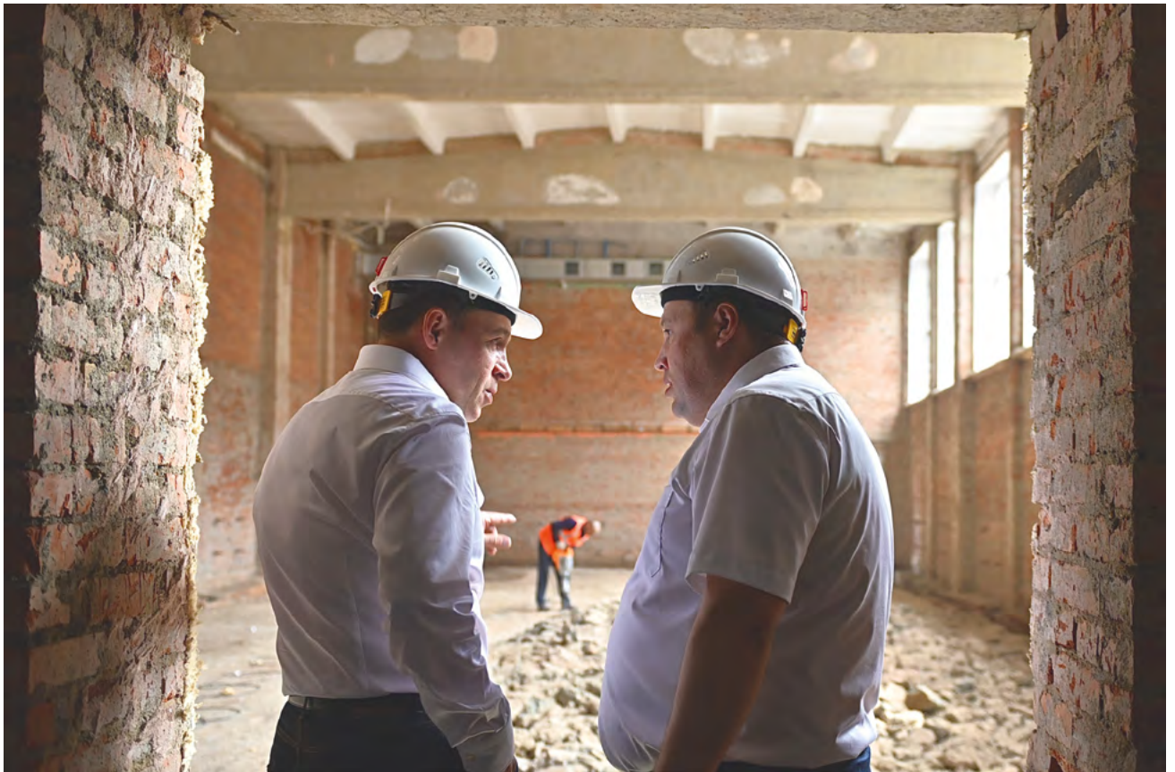
▲ В Волчанске капитально ремонтируют школу № 23: износ старого здания превышал 75 процентов, проводка не выдерживала нагрузок, система отопления сбоила. Строители планируют завершить работы к концу 2023 года.

«Жизнь в северных городах улучшается: снижается безработица, растет заработная плата, появляются новые рабочие места. С 2012 года запущено 11 новых производств, в создание которых инвестировано свыше 10 миллиардов рублей», — отметил глава региона. Но необходимо помочь северным предприятиям адаптироваться, встроиться в новые кооперационные и логистические цепочки, решить задачи импортозамещения, воспользоваться разнообразными инструментами поддержки.