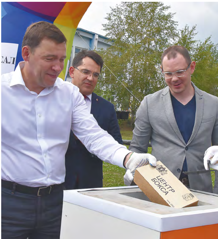
▲ Заложен камень в основание Центра бокса в Краснотурьинске.