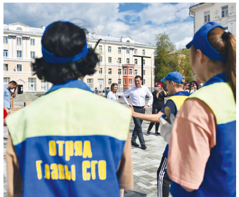
▲ Мальчики и девочки в ярких жилетах — трудовые отряды главы Североуральска: они наводят порядок в парках, на детских площадках и улицах.