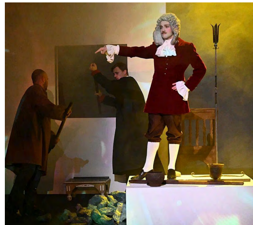
▲ В Екатеринбурге поставили спектакль о династии Демидовых