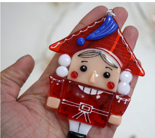
▲ От огня к свету: в ноябре Инновационный культурный центр приглашает на диалог со стеклом