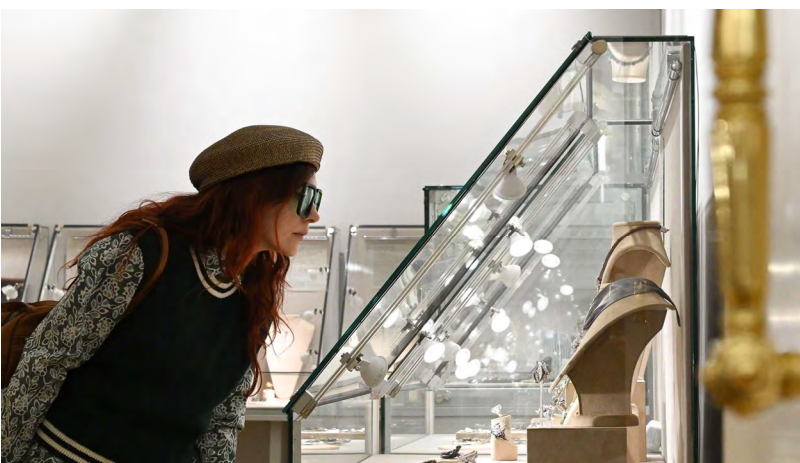
▲ Идеи, воплощенные в камне и металле: музей истории камнерезного и ювелирного искусства подвел итоги конкурса «Металл, камень, идея»