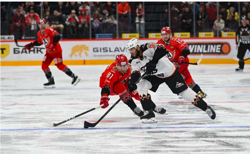
▲ «Автомобилист» одержал волевою победу над «Трактором»