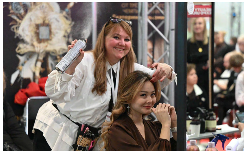
▲ Мастера индустрии красоты продемонстрировали свое искусство на Евроазиатском чемпионате в Екатеринбурге