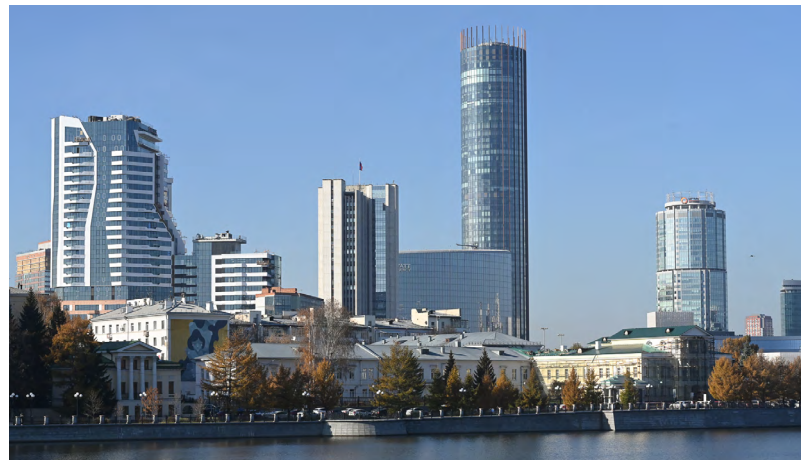
Новая система избрания глав заработает во всех свердловских муниципалитетах

Новые цифровые правила для маркетирования, майнинга и блогеров С начала месяца в систему «Честный знак» будут