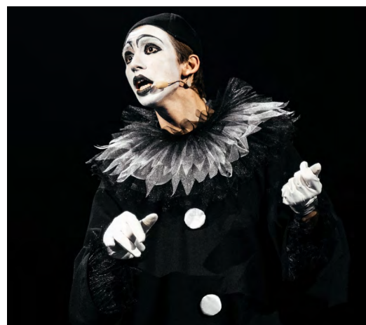
▲ В Нижнем Тагиле пройдет конкурс молодых артистов «АпАрте»