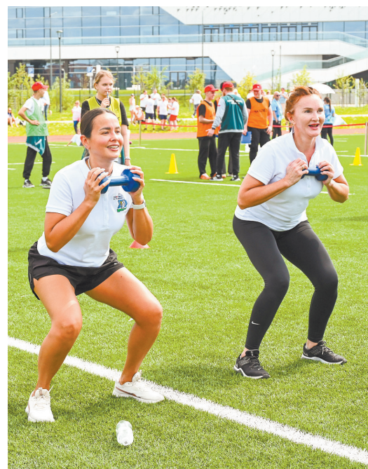
▼ Первые на Среднем Урале медицинские игры собрали более двух тысяч участников.