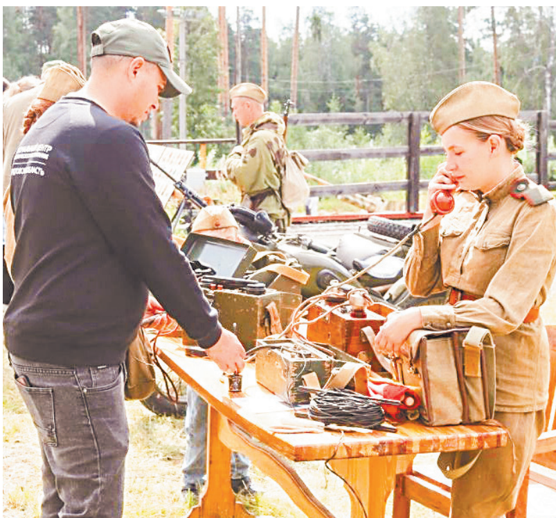
▲ От танков до формы: фестиваль «Уральская броня» оживил страницы военной истории.