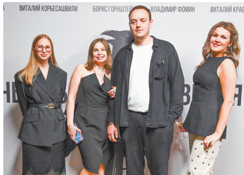
▲ «Раньше было такое время»: в Екатеринбурге прошла премьера черно-белой ленты об уральском роке.