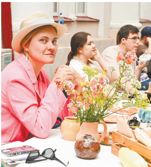
▲ Теплая атмосфера и зеленые идеи: как прошел фестиваль «Три куста» в Екатеринбурге.