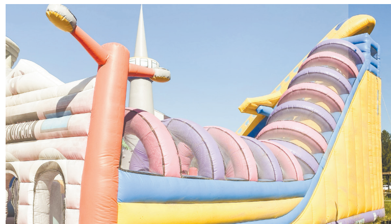
▲ Использование уличных аттракционов в Екатеринбурге скоро будут строго регламентировано

Более подробная информация – на официальном сайте Госдумы и в «Парламентской газете».