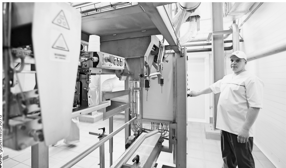
Если ранее сухое молоко уральцам поставлялось из-за рубежа, то теперь свердловчане сами будут обеспечивать им отечественный рынок в объеме 5,8% от общего производимого объема в России.

Уральский завод многогранных опор в Полевском при поддержке правительства области 28 ноября 2018 года запустил цех по производству трубчатых фундаментов и винтовых свай. Инвестиции в проект составили 45 миллионов рублей. По словам министра промышленности Сергея Пересторонина, современное оборудование в 25 раз сократит срок изготовления продукции. «Объем работ, который бригада из шести человек сделает за месяц, оборудование позволяет изготовить за две смены. Высвобождаемые работники